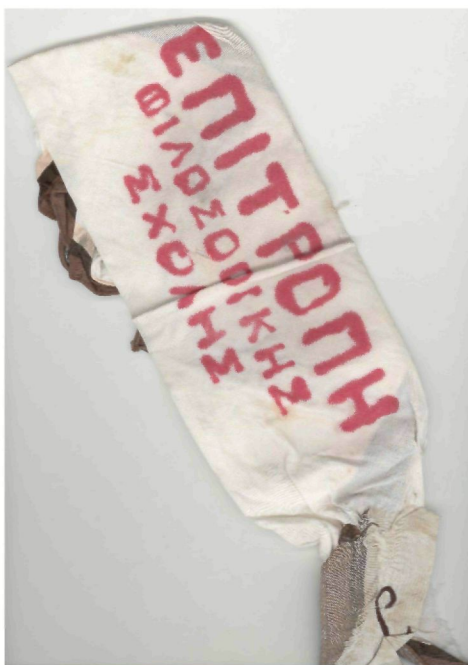
Αυτοσχέδιο περιβραχιόνιο από τα γεγονότα του Πολυτεχνείου (Νοέμβριος 1973).