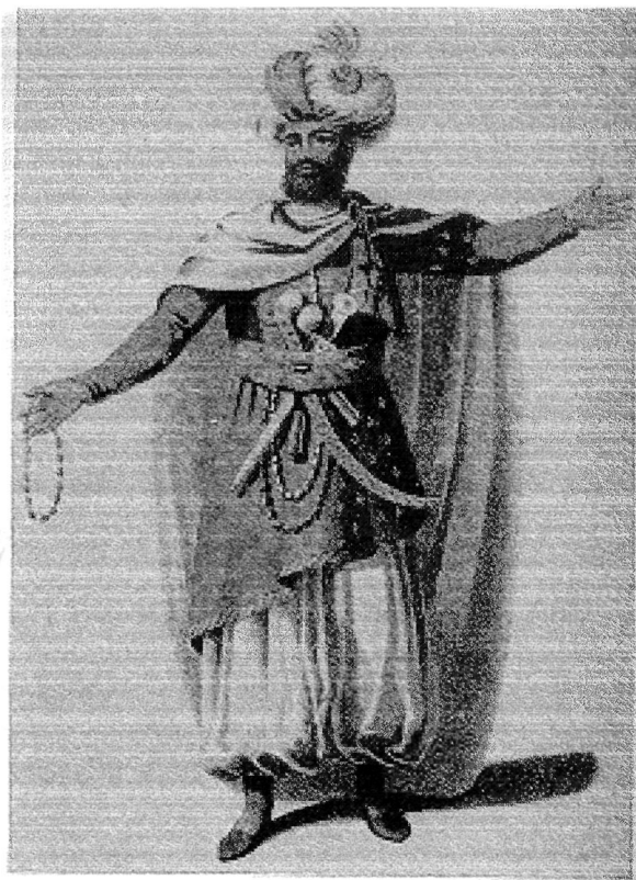
Ο πασάς της Τρίπολης Γιουσούφ Καραμανλής