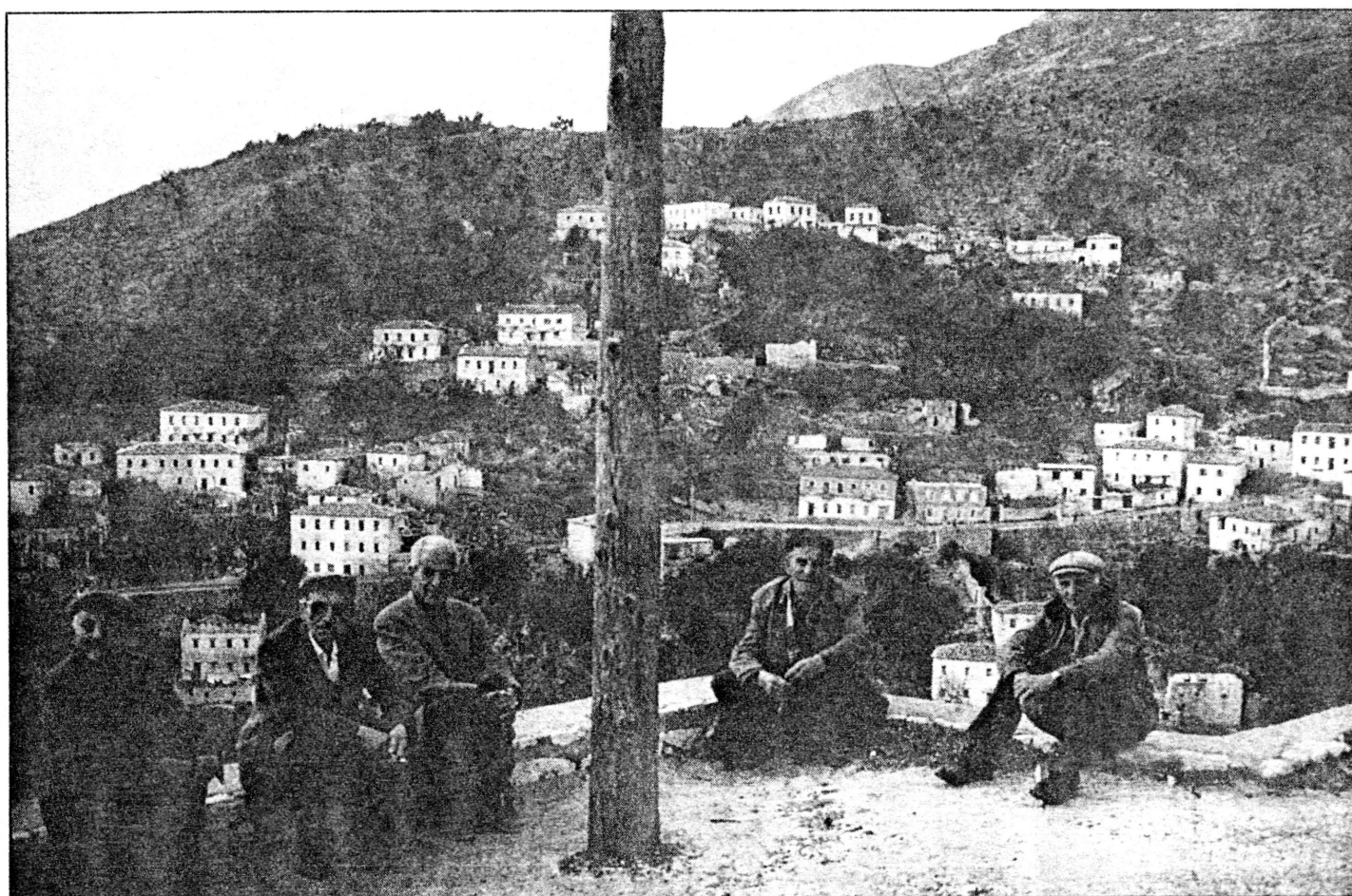
Δρυμάδες. Εικόνα καθημερινής ζωής. Κοντά στο χωριό υπάρχουν ίχνη αρχαίου συνοικισμού.

ε) Κουτσοβλάχους, κυρίως στην Πρεμετή και την Κορυτσά.