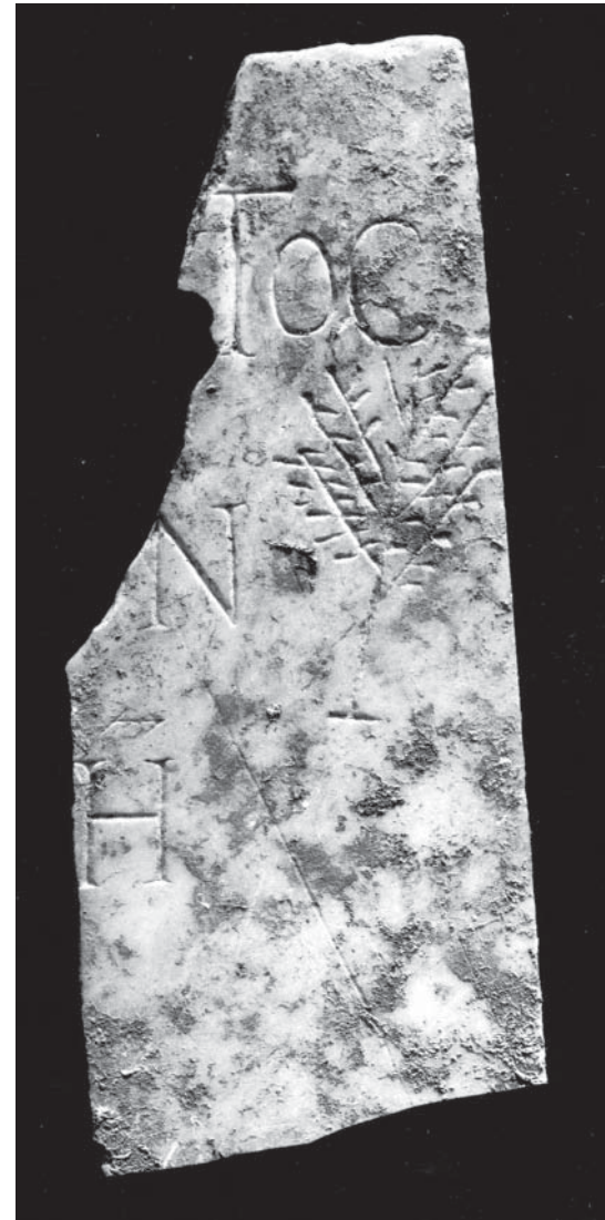
Nr. II b

Nr. I, Nr. IIa, Nr. IIb Inschriften aus Patras