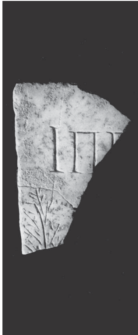
Nr. II a