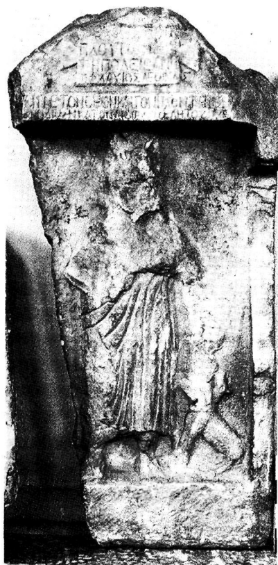
Εικ. 2. Αναθηματική στήλη από την Αιανή Κοζάνης με παράσταση Πλούτωνος.