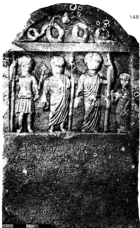
Εικ. 6. Επιτύμβια στήλη από τον Σκοπό Φλωρίνης.