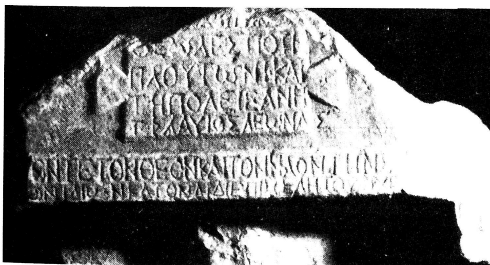
Εικ. 3. Αναθηματική στήλη από την Αιανή Κοζάνης με παράσταση Πλούτωνος (λεπτομέρεια).