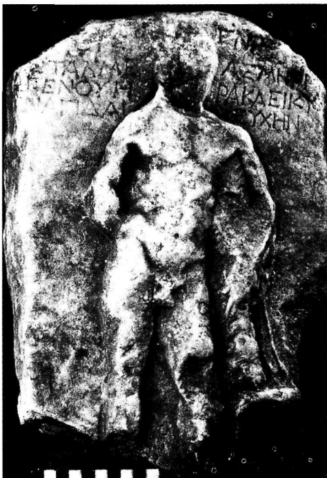
Εικ. 4. Ανάγλυφη στήλη από το Ρυάκι Εορδαίας με παράσταση Ηρακλέους Κυναγίδα.