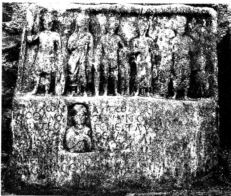
Εικ. 7. Επιτύμβια στήλη από τις Κάτω Κλεινές Φλωρίνης.