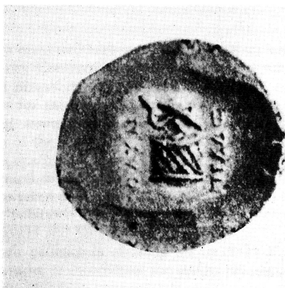
Ειχ. 12. Χρυσό «νικητήριο» από το εύρημα του Aboukir.