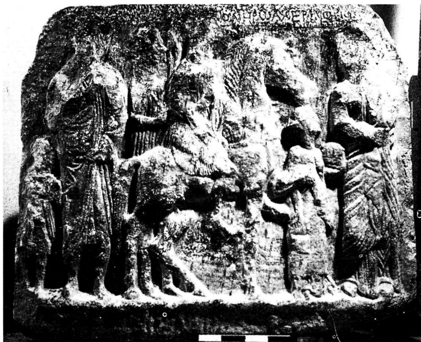
Εικ. 5. Απελευθερωτική επιγραφή από την Ελάτη Ελίμειας.