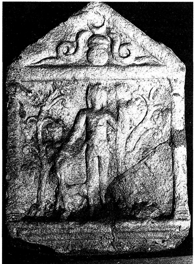
Εικ. 8. Αναθηματική στήλη από το Vlahcani.