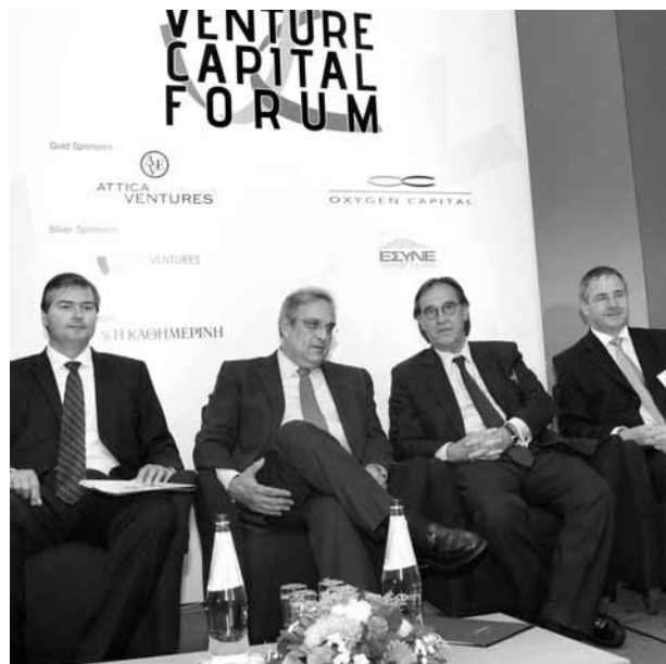
Από αριστερά: Δημήτρης Παζαΐτης, Πρόεδρος και Διευθύνων Σύμβουλος Οργανισμού Invest in Greece, Γιάννης Παπαθανασίου, Υπουργός Οικονομίας και Οικονομικών, Νικόλαος Χαριτάκης, Διευθύνων Σύμβουλος TANEO και Earley Rory, CEO Capital for Enterprise.

Η πλειοψηφία των προτάσεων στοχεύει στην παγκόσμια αγορά (46%), ενώ στην εγχώρια στοχεύει το 34%, στην τοπική αγορά το 8% και στη βαλκανική το 7%. Τη μερίδα του λέοντος διεκδικούν επιχειρηματικά σχέδια για την Αττική (70%), ενώ ακολουθούν οι περιφέρειες της Μακεδονίας (11%), Πελοποννήσου (7%), Δωδεκανήσων (4%) κ.ά. Το ύψος της χρηματοδότησης που ζητήθηκε για το σύνολο των επενδυτικών προτάσεων που υποβλήθηκαν ανήλθε στα 415 εκ. ευρώ.