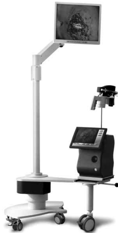
Το σύστημα DySIS

Σύμφωνα με τον Δρα Κ. Μπάλα (καθηγητή του Τμήματος Ηλεκτρονικών Μηχανικών και Μηχανικών Υπολογιστών του Πολυτεχνείου Κρήτης και πρώην ερευνητή του Ινστιτούτου Ηλεκτρονικής Δομής και Laser του ΙΤΕ), η συσκευή DySIS ανιχνεύει και ταυτοποιεί αντικειμενικά προκαρκινικές αλλοιώσεις σε πρώιμο-θεραπεύσιμο στάδιο. Αυτό επιτυγχάνεται με την καταγραφή και ανάλυση της αλληλεπίδρασης φωτός και ιστού, ενώ η εξεταστική διαδικασία δεν απαιτεί επαφή με τον ιστό. Είναι δε αναίμακτη, ανώδυνη και διαρκεί μερικά μόνο λεπτά.