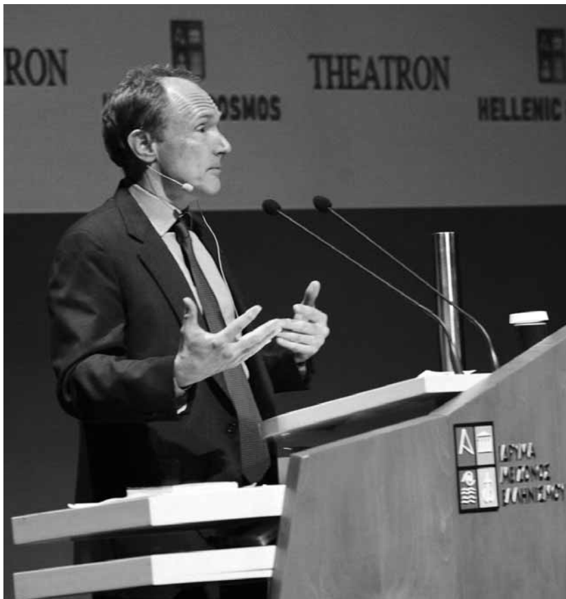
Ο Sir Tim Berners Lee στο συνέδριο του ΙΜΕ.

Οι εισηγήσεις των ομιλητών διατίθενται στον δικτυακό τόπο του συνεδρίου.