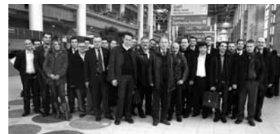
Στιγμιότυπο από την ελληνική επιχειρηματική αποστολή στη CeBIT 2009.

αντίξοι οικονομική συγκυρία, ο κλάδος της Πληροφορικής αναζητά τρόπους και κινείται δυναμικά για να δώσει διεξοδο. Προς αυτή την κατεύθυνση ιδιαίτερα σημαντική κρίνεται η στροφή προς λύσεις που υπόσχονται μείωση κόστους και ενέργειας, με παράλληλη αύξηση της αποδοτικότητας και της κερδοφορίας αντίστοιχα.