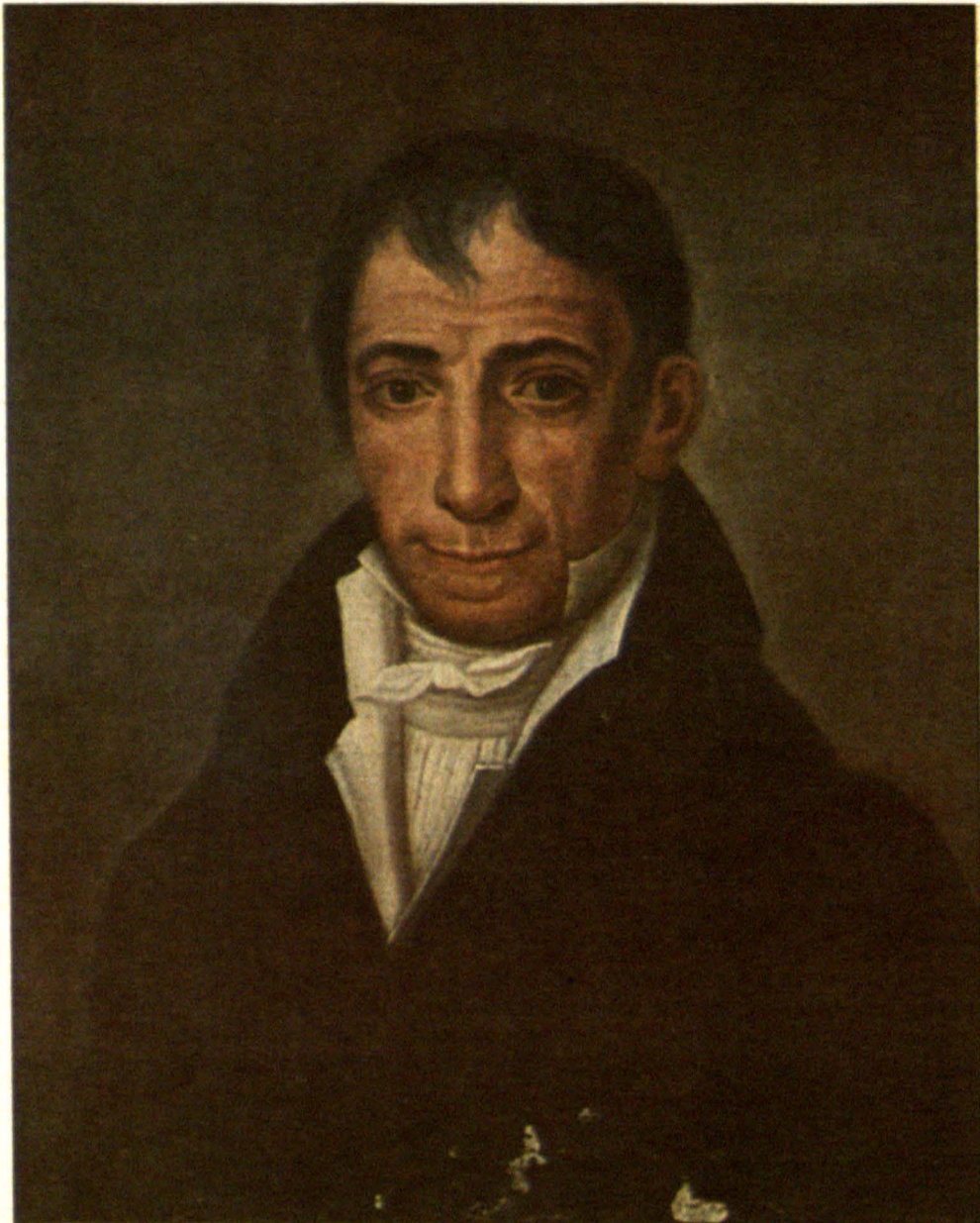
Πορτρέτο του Αδ. Κοραή, η ελαιογραφία που φυλάσσεται ακόμη στο σπίτι του Κωνσταντίνου Τυπάλδου-Ιακωβάτου, σήμερα βιβλιοθήκη-μουσείο Τυπάλδων-Ιακωβάτων στο Ληξούρι.