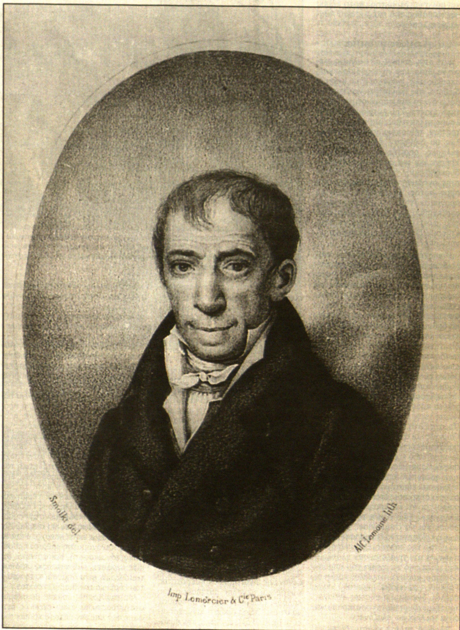
Η προσωπογραφία του Κοραή, την οποία «υπέκλεψε» ο Πολωνός ζωγράφος Σμόλνι, με τέχνασμα των μαθητών του Κοραή, στη διάρκεια δύο επισκέψεων στο σπίτι του, εμφανιζόμενος ως φιλέλληνας και θαυμαστής του.

Δικαιολογημένος ήταν ο φόβος των Κυδωνιατών για αρνητική απάντηση του Κοραή, αφού λίγους μήνες νωρίτερα διατύπωνε στον Αλέξανδρο Βασιλείου το δικό του λακωνικό εκβιασμό: «Οι Αυτοσχέδιοι στοχασμοί ή να τυπωθώσι χωρίς εικόνα ή να μη τυπωθώσι παντάπασι. Είναι ασυγχώρητον εις εμέ να καταστήσω γελοίας τας ολίγας ημέρας ή ώρας, όσας ακόμη μέλλω να πατώ εις την γην». Και σε εκείνη την περίπτωση δεν ήταν βέβαια δυνατό ο Κοραής να παραβεί τη συμβουλή, που έδινε ο ίδιος, πέντε χρόνια νωρίτερα: «συγχωρείται εις την ηλικίαν μου να παρακαλέσω τους νέους να μη μιμηθώσι το έθος τινών συγγραφέων της φωτισμένης Ευρώπης, να βάλλωσιν αυτοί εαυτών τας εικόνας εις την κεφάλην των βιβλίων». Τώρα όμως το αίτημα των Κυδωνιατών, διατυπωμένο τόσο άμεσα και συγκινητικά, ήταν σε αντιστοιχία με τη δική του γνώμη: «Η πατρίς μόνη έχει το δικαίωμα να ανταμείβη τα καλά (...) ο σκοπός της είναι να παρακινήση και τα λοιπά της τέκνα». Η μετριοφροσύνη και η ανυποχώρητη υπεράσπιση του ιδιωτικού, βρήκαν και αυτή τη φορά λογικά επιχειρήματα στην απάντησή του (Ιανουάριος 1815). Η εξομολόγηση, που προηγείται, διασώζει το ανθρώπινο πρόσωπο του «απόλυ-