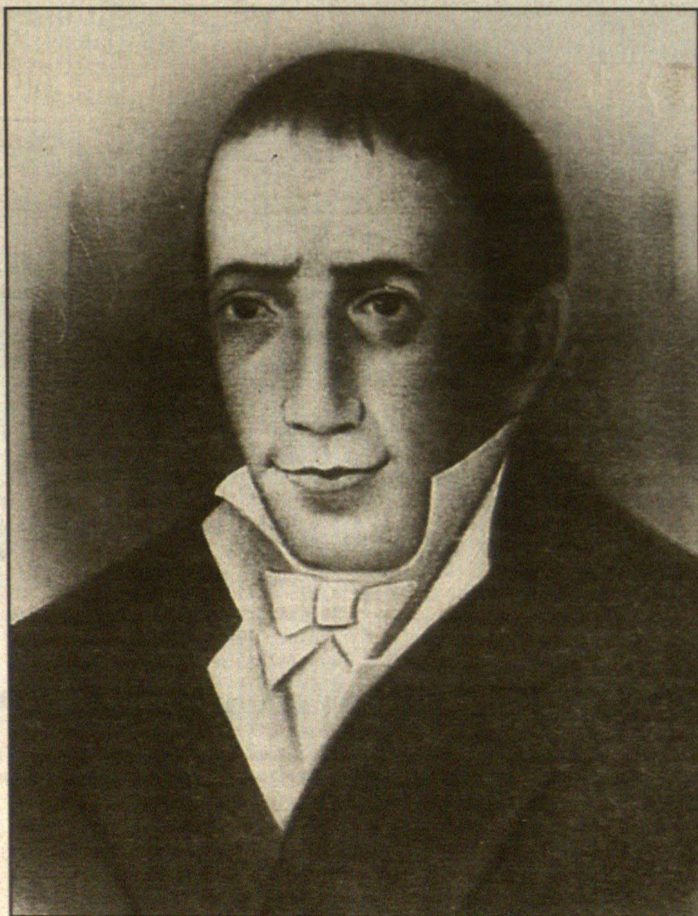
Πορτρέτο του Αδαμάντιου Κοραή, με τάση ωραιολογικής του μακρινού του προτύπου, της λιθογραφίας του Σμόλκι. Εθνική Βιβλιοθήκη, Αθήνα.

Περισσότερη διάδοση είχε μια άλλη λαϊκή λιθογραφία του 19ου αι. τυπωμένη στο Παρίσι, που παριστάνει ολόσωμους τον Κοραή και τον Ρήγα να ανασκάνουν την Ελλάδα εν μέσω ερειπίων. Τα ιδεολογικά σημειώματα της λιθογραφίας είναι προφανή και καθώς η εικονογραφία της ξεπερνά τα όρια της προσωπογραφίας, η παράσταση αυτή διέδωσε περισσότερο την «ιδεολογία» με την οποία συνδέθηκε ο Κοραής, αφού οι προσεγγίσεις προς το πρόσωπο και το έργο του «θόλωσαν» στη δίνη των εθνικών ιδεολογικών αποκρυσταλλώσεων και των κατευθύνσεων της νεοελληνικής παιδείας.