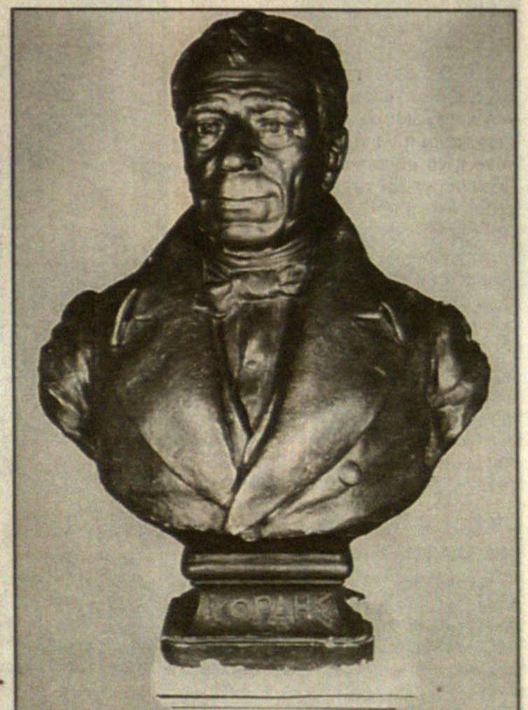
Πρόπλασμα της ορειχάλκινης προτομής του Κοραή, που στήθηκε στον τάφο του, στο Παρίσι, στις 25 Μαρτίου 1895.