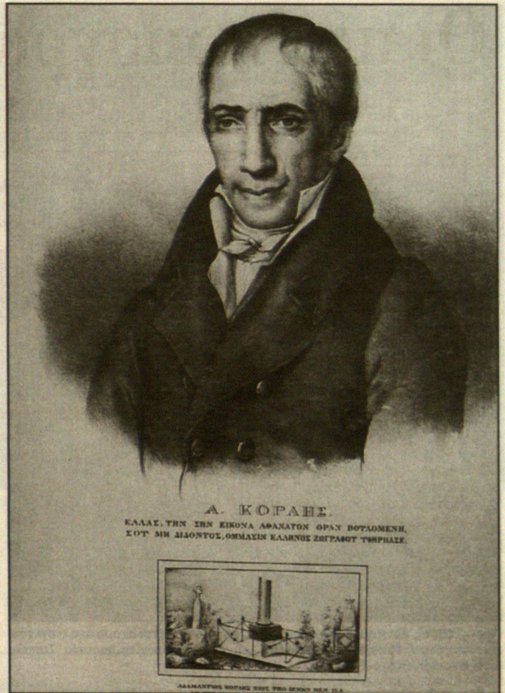
Παραλλαγή της λιθογραφίας του Σμόλνι, με το γνωστό επίγραμμα. Στο κάτω μέρος, η εικόνα του τάφου του Κοραή στο κοιμητήριο του Μονπαρνάς, στο Παρίσι, και το επιτάφιο επίγραμμα. Τυπώθηκε από τον Α. Χαβιαρά στο Παρίσι, λίγο μετά το θάνατό του.

την άρνηση, προβάλλοντας τα υψηλά παραδείγματα των αρχαίων, από τους οποίους κανένας δεν στεφάνωσε τον εαυτό του «ούτε της ίδιας του μορφής ανέστησεν εικόνα». Το παράδειγμα του Αγησιλάου τον εκφράζει: «δεν εσυγχωρούσεν να του κάμωσιν εικόνα».