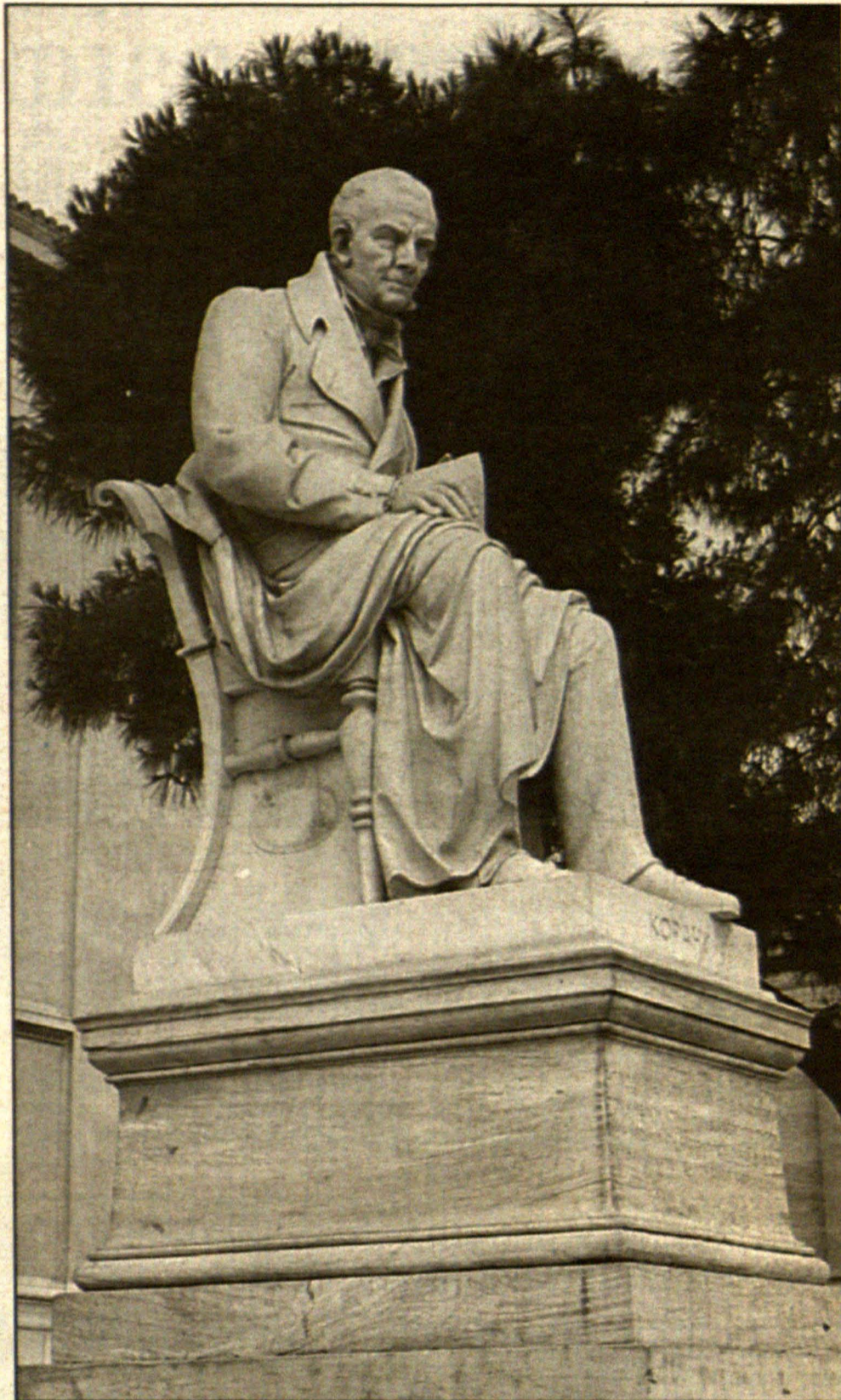
Ο ανδριάντας του Κοραή στα Προπύλαια του Πανεπιστημίου Αθηνών, έργο του Γεωργίου Βρούτου (1873). Τοποθετήθηκε στη θέση όπου βρίσκεται έκτοτε, το 1875.

Συνέχεια από την 19η σελίδα σε μετά τη δεύτερη και αποχαιρετιστήρια επίσκεψη.