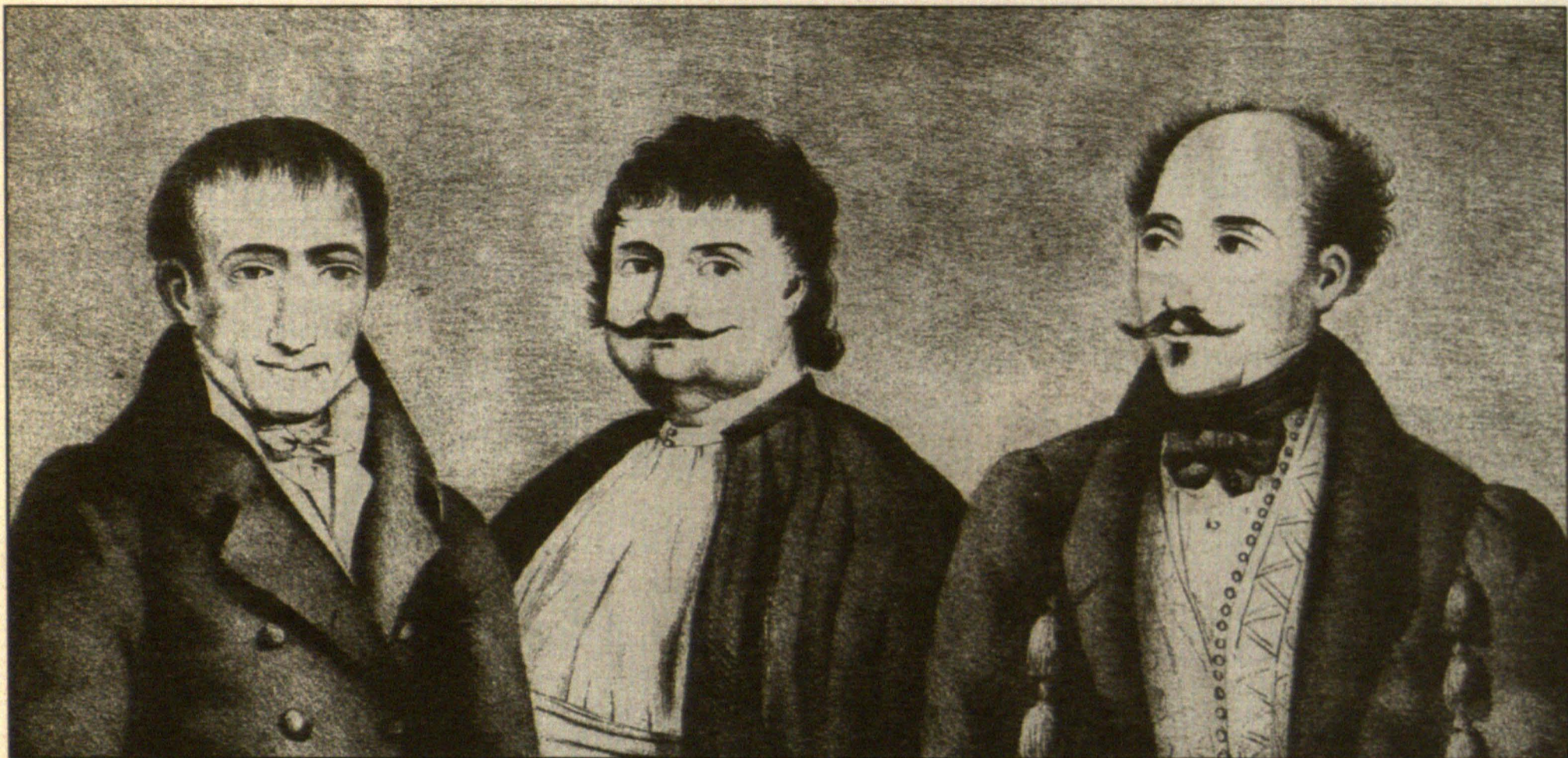
Πολυπρόσωπη λαϊκή λιθογραφία με τις μορφές του Κοραή, του Ρήγα και του Αλ. Υψηλάντη. Εκδόθηκε στο Λούγδουνο το 1849, και γνώρισε πολλές άλλες εκδόσεις παραλλαγών της.

1829: «Αδαμάντιος Κοραής Χίος υπό ξένην μεν ίσα δε τη φυσάση μ' Ελλάδα πεφιλημένην γην των Παρισίων κείμαι». Η δημοσίευση της λιθογραφίας της προτομής θα επηρεάσει κυρίως τις προτομές και τους ανδριάντες που θα στηθούν προς τιμήν του. Την προτομή αυτή θα μεταφέρει ο Λύσανδρος Καυτατζόγλου στην Αθήνα το 1858. Νωρίτερα, το 1855, ο Ιω. Κόσσης θα λαξεύσει ωραιολογική μορφή του Κοραή σε μια προτομή-δώρο του Πέτρου Εμμ. Σκυλίτση στη Σχολή της Χίου. Το 1875 θα στηθεί μπροστά στο πανεπιστήμιο ο ανδριάντας του, έργο του Γεωργίου Βρούτου. Το 1877 γίνεται η μετακομιδή των οστών του στην Αθήνα και το 1895 θα στηθεί στο κενοτάφιο του Παρισιού προτομή του Κοραή, έργο του Α. Σώχου. Το 1952 στήθηκε και ο δεύτερος ανδριάντας του έξω από τη Βιβλιοθήκη της Χίου, έργο του Γιάννη Παπά.