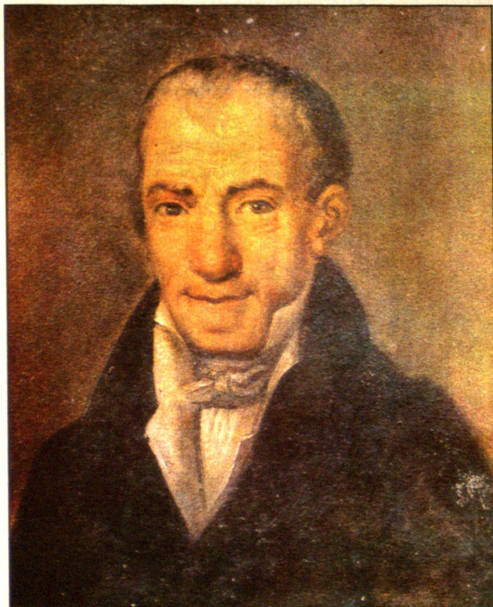
Πορτρέτο του Αδ. Κοραή, έργο του Διονυσίου Τσόκου, με πρότυπο τη λιθογραφία του Σμόλνι, Πανεπιστήμιο Αθηνών.