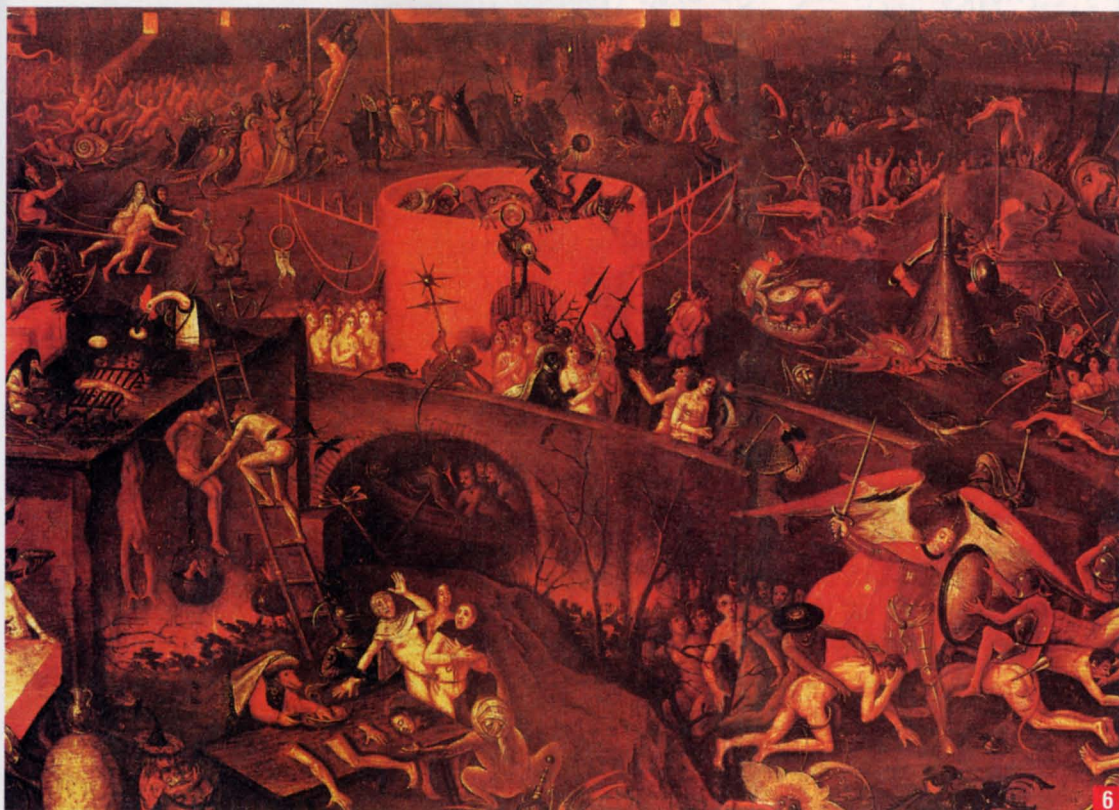
6. Λεπτομέρεια από την «Κόλαση» του Ιερώνυμου Μπος (Palazzo Ducale, Βενετία)

χουν πολλοί τρόποι επανόρθωσης της αδικίας: μέσω της απόδοσης των αρπαγέντων ακόμη και εκ μέρους των συγγενών του αφορισθέντος, υπάρχει η, πολλές φορές επί χρήμασι, άρση της ποινής, υπάρχουν ευχές, δεήσεις, συγχωροχάρια κ.λπ. κ.λπ.