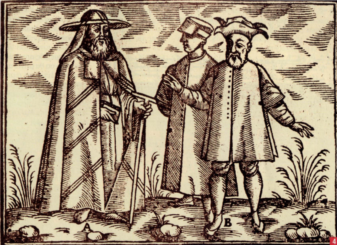
4. Κατά την Τουρκοκρατία ο αφορισμός επιβαλλόταν από την κορυφή της ιεραρχίας, πατριάρχες και μητροπολίτες. Ο ορθόδοξος πατριάρχης Κωνσταντινυπόλεως με κοσμικούς. Ξυλογραφία (Νιρεμβέργη 1639) από το βιβλίο του Salomon Schweigger «Νέα περιγραφή ταξιδιού από τη Γερμανία στην Κωνσταντινούπολη και Ιερουσαλήμ»

επειδή τα υποκείμενα στο φόβο ανήκουν σε διάφορες περιόδους και σε διάφορες πολιτισμικές κατηγορίες, η αντίστοιχη αποτελεσματικότητα έχει τα όριά της που πέρα από την ατομική περίπτωση καθορίζονται και από άλλους παράγοντες (μεγάλο οικονομικό συμφέρον, οριακό γεγονός, π.χ. Ελληνική Επανάσταση).