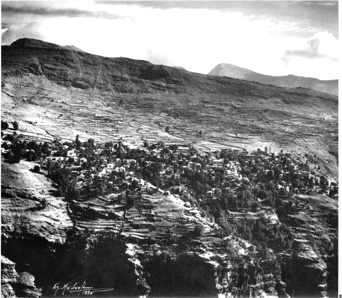
5. Οι Καλαρρύτες σε φωτογραφία του Σπ. Μελετζή 1938. Από τη συλλογή του κ. Α. Βογιάρου.