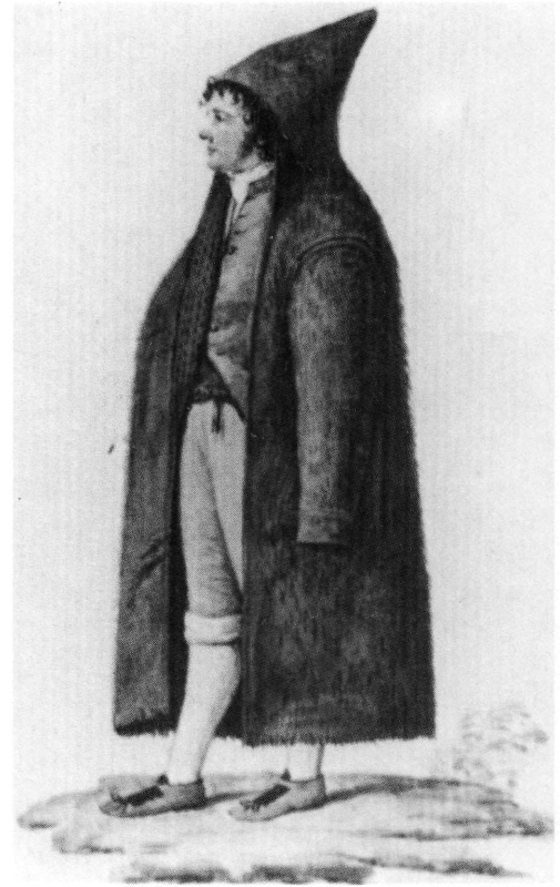
1. Επενδύτης “ alla greca ” S. Anselmi (επιμ.), La Provincia di Ancona. Storia di un territorio , Μπάρι 1987, σ. 297).

Εδώ θα πρέπει να γίνει μια ιδιαίτερη αναφορά στη βιοτεχνική παραγωγή του μάλλινου· επενδύτη στην περιοχή της Αγκώνας (Matelica), στην ενδοχώρα της οποίας είναι γνωστή η παραγωγή μάλλινου υφάσματος από τον 16ο αι. Το μάλλινο υφάσμα που παραγόταν στην ενδοχώρα της Αγκώνας ήταν χαμηλότερης ποιότητας και ακριβότερο από το λαθραία εισαγόμενο ελληνικό ή ακόμη και από αυτό που κατασκευαζόταν στην Αγκώνα από την ελληνική παροιμία. Πρόκειται για μάλλινο υφάσμα με μεγάλη ζήτηση ονομαζόμενο zagara 17 ή caravano , το οποίο από το 1810 παράγεται και από τους ντόπιους. 18 Οι συγκρούσεις φαίνεται ότι ήταν έντονες· έτσι όταν το 1808 ο G. Fiaccarini βραβεύεται ως ο πρώτος κατασκευαστής στη Ματελίκα (Matelica) των περιφημών ναυτικών επενδυτών κατά τον ελληνικό τρόπο ( cappotti alla greca ), «που πρώτα κατασκευάζονταν στην Άρτα», συναντά τη σθεναρή αντίσταση των παλιών παραγωγών· ώστε φθάνει να κατηγορηθεί ότι οι επενδυτές του ήσαν ελληνικής προέλευσης, ή τουλάχιστον προϊόντα της ελληνικής παροιμίας της Αγκώνας. 19 Έτσι η παραγωγή και η διακίνηση του χοντρού μάλλινου υφάσματος γίνεται ένα από τα σημαντικότερα σημεία επικοινωνίας μεταξύ Ηπείρου και Ιταλίας στον χώρο της Αδριατικής (βλ. εικ.1).