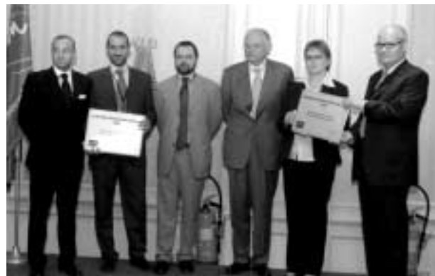
Στιγμιότυπο από την απονομή των βραβείων καινοτομίας του δικτύου IRC

Το βραβείο για την καλύτερη αξιοποίηση ερευνητικών αποτελεσμάτων αφορά ένα νέο λογισμικό προσομοίωσης χύτευσης, που ανέπτυξε το ερευνητικό κέντρο VTT Technical Research Centre of Finland και αξιοποιήθηκε με μεγάλη επιτυχία από μικρά κυτήρια στην ιταλική περιοχή της Λομβαρδίας.