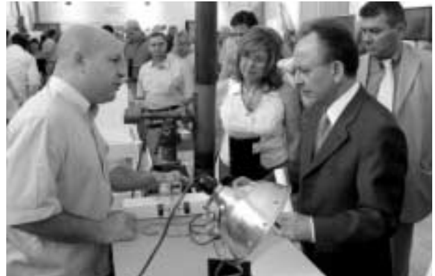
Στιγμιότυπο από την επίσκεψη του υπουργού Ανάπτυξης Δ. Σιούφα στο περίπτερο του ΕΙΕ

Επίσης, οι επισκέπτες είχαν την ευκαιρία να παρακολουθήσουν διασύνδεση του χώρου του Ζαππείου με κάποιο απομακρυσμένο σχολείο μέσω Διαδικτύου, αξιοποιώντας τις δυνατότητες του ελληνικού δορυφόρου Hellas Sat. Παρου-