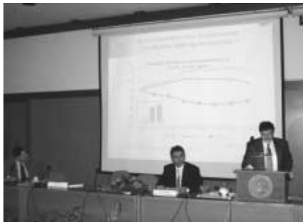
Από αριστερά προς τα δεξιά: Ξ. Τσιλιμπάρης, Θ. Χρυσάφης, Ε. Φίλος

Στις εκδηλώσεις συμμετείχε ο Εθνικός Εκπρόσωπος κ. Ξ. Τσιλιμπάρης, ο οποίος παρουσίασε στατιστικά στοιχεία και συμπεράσματα για τη συμμετοχή των ευρωπαϊκών ερευνητικών ομάδων στις πρώτες προσκλήσεις του IST. Την περίοδο 2003-2004 διατέθηκαν 1,9 δισ. ευρώ, από τα 3,8 δισ. ευρώ από προβλέπονται στο συνολικό προϋπολογισμό του 6ου ΠΠ για το IST. Υποβλήθηκαν περίπου 2.500 προτάσεις και χρηματοδοτήθηκαν περισσότερα από 400 έργα, στα οποία συμμετείχαν 6.500 φορείς.