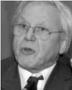
Ο Sir David Attenborough