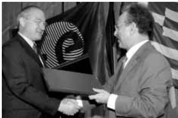
Ο Υπουργός Ανάπτυξης κ. Δημήτρης Σιούφας και ο Γενικός Διευθυντής του ΕΟΔ κ. Jean-Jacques Dordain

Με την ένταξη στον ΕΟΔ ως πλήρες μέλος, η Ελλάδα θα συμμετέχει ισότιμα με τα υπόλοιπα κράτη μέλη στη λήψη αποφάσεων για τη χάραξη διαστημικής πολιτικής σε ευρωπαϊκό επίπεδο. Οι ελληνικές επιχειρήσεις θα έχουν τη δυνατότητα συμμετοχής σε περισσότερα προγράμματα του Οργανισμού, βελτιώνοντας έτσι την τεχνολογική βάση και την ανταγωνιστικότητά τους και δημι-