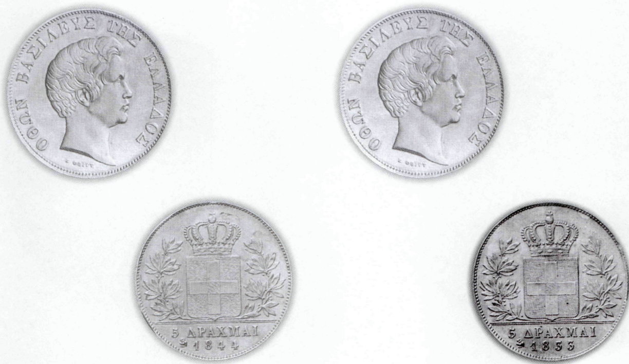
▲ Εικ. 13: Σπάνια έκδοση αργυρού πεντάδραχμου του αθηναϊκού Νομισματοκοπείου με νομισματόσημο την κουκουβάγια του έτους 1833 και 1844.

Άρθρον 1ον: «Ἐπιτρέπεται ἡ ἐκτύπωσις ἀργυρῶν Ἑλληνικῶν νομισμάτων παρὰ τοῦ Ἡμετέρου Νομισματοκοπείου διὰ λογαριασμὸν τῶν ἰδιωτῶν».