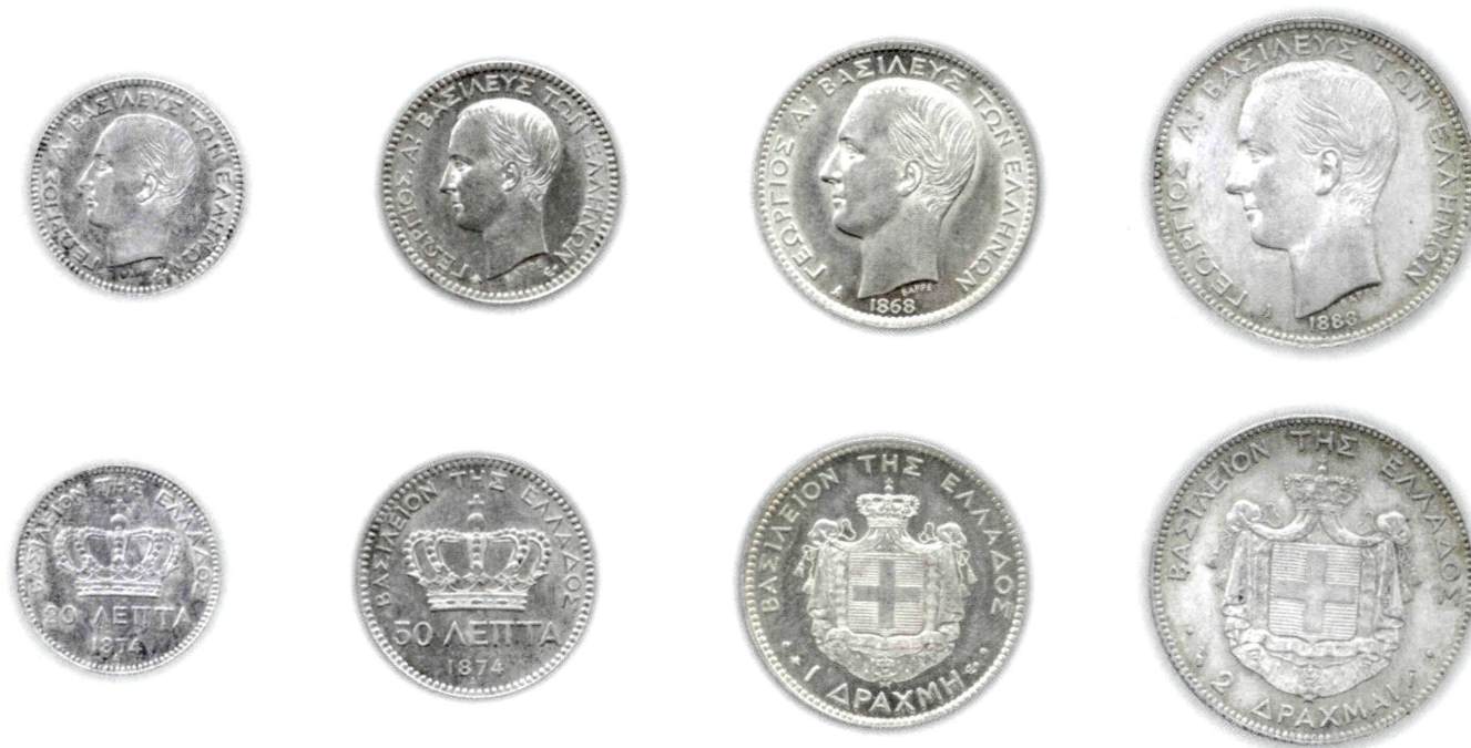
Εικ. 17: Αργυρά κέρματα του Γεωργίου Α'.

δραχμές ανά κάτοικο που αργότερα αυξήθηκε σε 3 δραχμές.