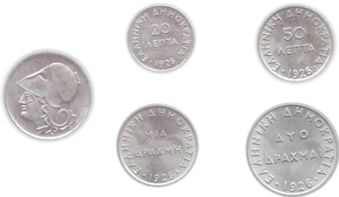
Εικ. 25: Τα χαλκονικέλινα κέρματα των 20 και 50 λεπτών, 1 και 2 δραχμών της Ελληνικής Δημοκρατίας του 1926.

Τα κέρματα των 10 και 20 δραχμών έρχονται να ολοκληρώσουν μια ομοιογενή πραγματικά σειρά.