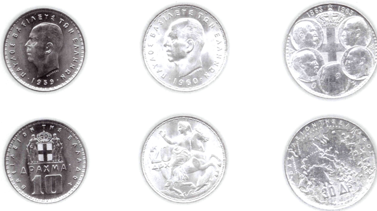
Εικ. 29: Νικέλινο δεκάδραχμο και αργυρά εικοσάδραχμα και τριαντάδραχμα του Παύλου.

τους αξία βασιζόταν στην κοινή αποδοχή και όχι στην εσωτερική τους αξία (αξία μετάλλου), η οποία ήταν κατώτερη της ονομαστικής λόγω του ευτελούς μετάλλου.