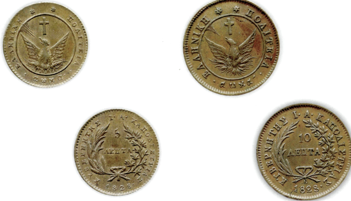
Εικ. 3: Τα 5 και 10 λεπτά του 1828 με ακτίνες συγκεντρωτικές.

ρουσιάστηκαν τα νέα νομίσματα του αργυρού Φοίνικα και των χάλκινων λεπτών (Εικ. 3), τα οποία διένειμε ο Γραμματέας της Επικρατείας σε έναν έκαστο των 237 πληρεξουσίων που είχαν εκλεγεί σε 84 περιφέρειες και των 3 πληρεξουσίων των όπλων.