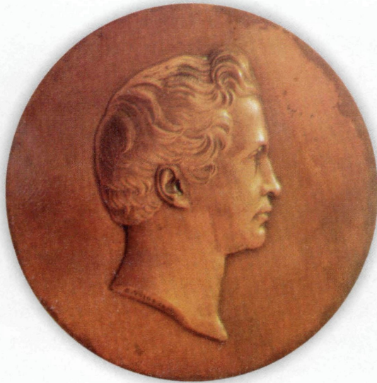
Εικ. 9: Ανάγλυφο με την υπογραφή «C. VOIGHT 1836».