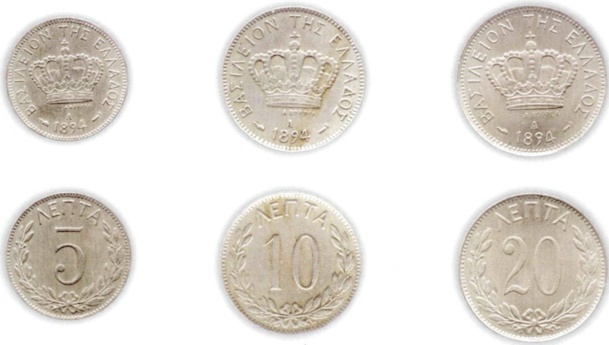
Εικ. 20: Χαλκονικέλινα νομίσματα του Γεωργίου Α', γνωστά ως κορωνάκια.

και να μην φυγαδευθούν εκ νέου, μέτρο που είχε λάβει νωρίτερα και η Ιταλία. Αποτέλεσμα αυτού είναι η επιστροφή στη χώρα μας από τη Λ.Ν.Ε. ασπμένιων ελληνικών κερμάτων αξίας 6.274.588 δραχ. επί συνόλου κοπής και κυκλοφορίας 10.800.000 δραχ. Εάν δε προσθέσουμε και αυτά που παρέμειναν σε άλλες χώρες, τότε αντιλαμβανόμαστε τις διαστάσεις της φυγάδευσης.