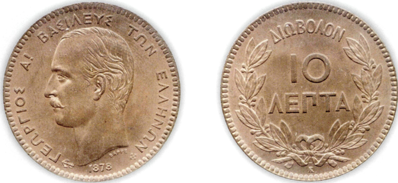
Εικ. 19: Χάλκινο 10λεπτο Γεωργίου Α', ώριμη κεφαλή του βασιλέα.

Αυξανόμενη της εκροής τόσο αύξανε και η ανάγκη εισροής άλλων (ξένων) αργυρών νομισμάτων για τις συναλλαγές της χώρας στο εξωτερικό. Το Β.Δ. της 11-7-1875, προσπαθώντας να βάλει τάξη, διατίμησε την πληθώρα των κυκλοφορούντων αργυρών νομισμάτων εκτός Λ.Ν.Ε.