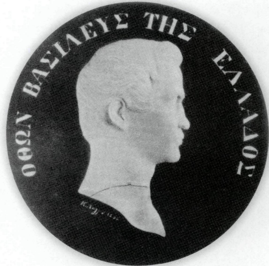
Εικ. 10: Κέρινο πρόπλασμα Όθωνος σε πέτρα με υπογραφή «Κ. Λάνγκε 1838».

- Συλλογής Παύλου Ασπρογέρακα 9 . Δημοπρασία Μαρτίου 1980, Ζυρίχη lot No 712.