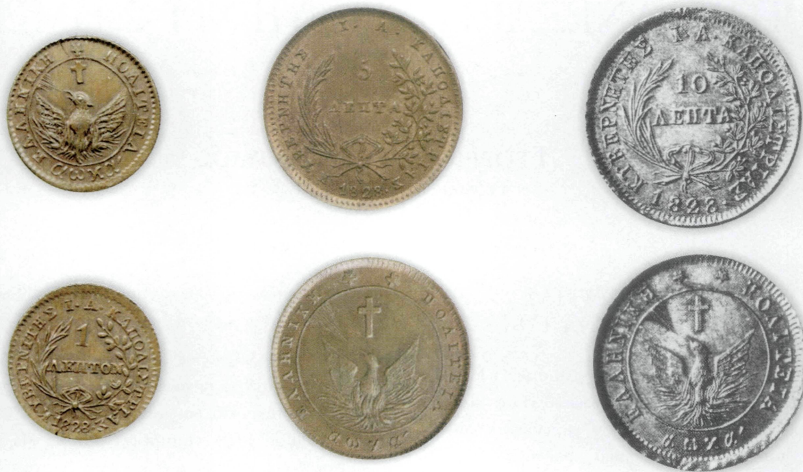
Εικ. 1: Τα χάλκινα δοκίμια των 1, 5 και 10 λεπτών του 1828 του Ι. Καποδίστρια.