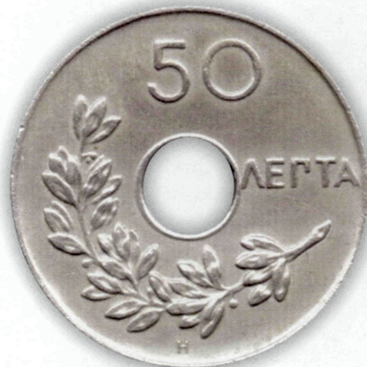
▲ Εικ. 23: Το χαλκονικέλινο 50λεπτο του 1921.