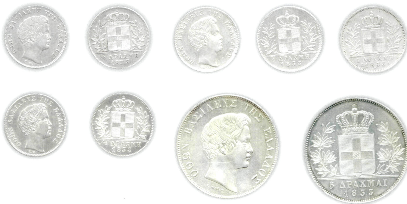
Εικ. 6: Αργυρά νομίσματα του Όθωνος αξίας ¼, ½, 1 και 5 δραχμών.