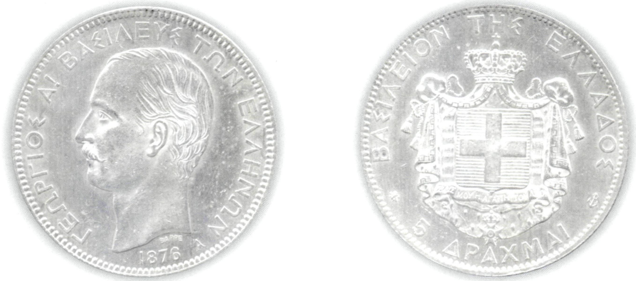
Εικ. 16: Αργυρό νόμισμα των 5 δραχμών του Γεωργίου Α'.