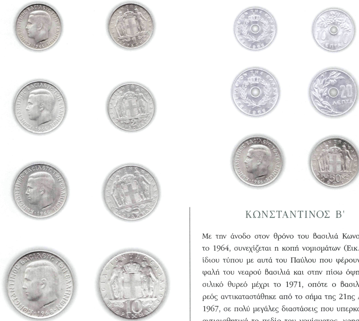
Εικ. 30: Η πρώτη σειρά κερμάτων του Κωνσταντίνου Β'.