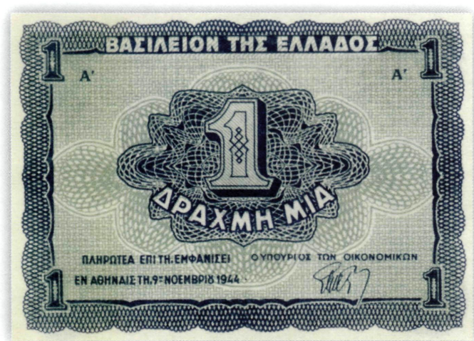
Εικ. 27: Η νέα μεταπολεμική δραχμή που αναλογούσε σε 50 δις κατοχικές δρχ.

Βρυξελλών (1.500.000 τεμ.), διακρίνονται δε από την ελιά στον κλώνο με τελεία, των Βρυξελλών.