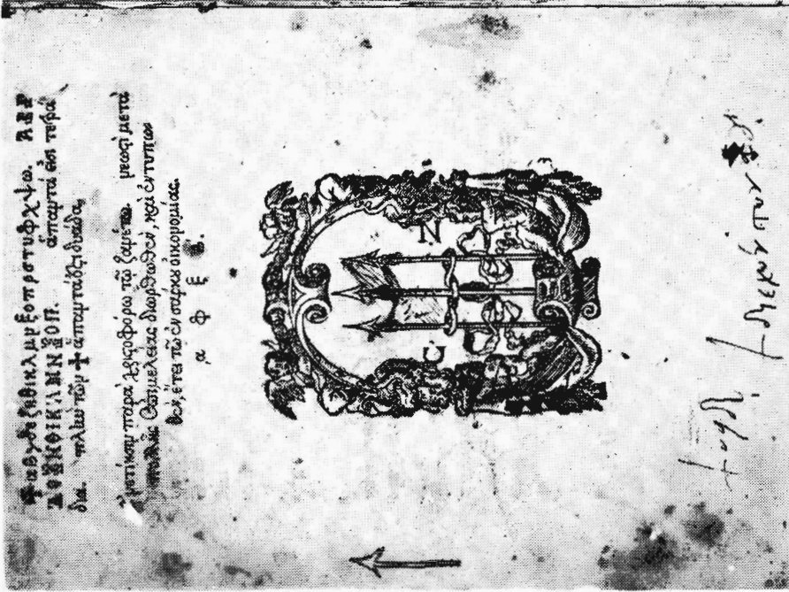
3. Η τελευταία σελίδα του άριθ. 4.