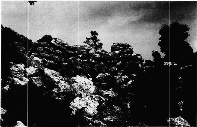
Εικόνα 1. "Αποψη του τείχους.

γηση των υπόλοιπων οστράκων είναι αδύνατη λόγω της φθοράς τους.