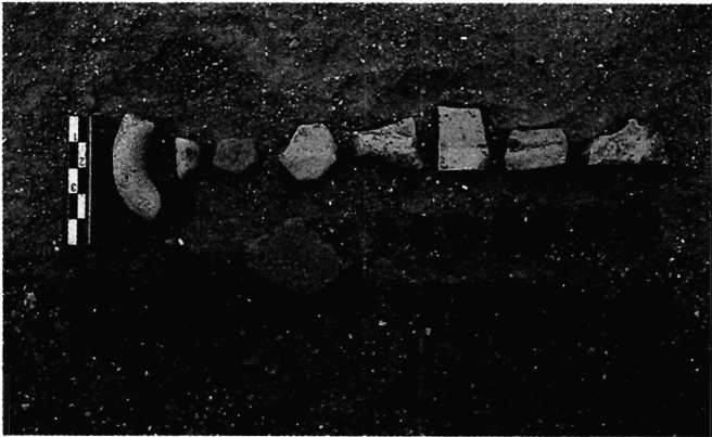
Εικόνα 2. Ευρήματα από την Παναγιά Κέρτεζης.

της περιοχής, που παρουσιάζει ακόμη σοβαρά προβλήματα, ως την όριστική της αποσαφήνιση.