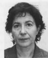
ΤΗΣ ΜΑΡΙΑΣ ΧΡΙΣΤΙΝΑΣ ΧΑΤΖΗΩΑΝΝΟΥ

Χωριό της βιοτεχνίας και της μετανάστευσης.