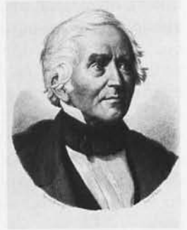
ΦΡΗΝΤΡΙΧ ΤΙΡΣ (1784- 1860).

εμπορευμάτων του, με στόχο την πάταξη του λαθρεμπορίου. Μια αυτόνοπη πρόβλεψη, αφού τα έσοδα από τους δασμούς αποτελούσαν σταθερή πηγή τροφοδότησης των δημόσιων οικονομικών του νεοσύστατου κράτους. Χαρακτηριστικό παράδειγμα του θεσμικού πλαισίου του εμπορίου, που οργανώνεται ήδη από την περίοδο της Αντιβασιλείας στην Ελλάδα, είναι τα διαπύλια τέλη. Θεσπίστηκαν το 1833 και τυποποιήθηκαν μετά το 1847. Εξαιτίας τους δημιουργήθηκαν σιγά σιγά διαφοροποιήσεις στο ελληνικό κράτος, που μακροχρόνια καθυστέρουσαν την ενοποίηση της εσωτερικής αγοράς. Ήταν ένα είδος δημοτικού φόρου, στον οποίο υποβάλλονταν τα εισερχόμενα