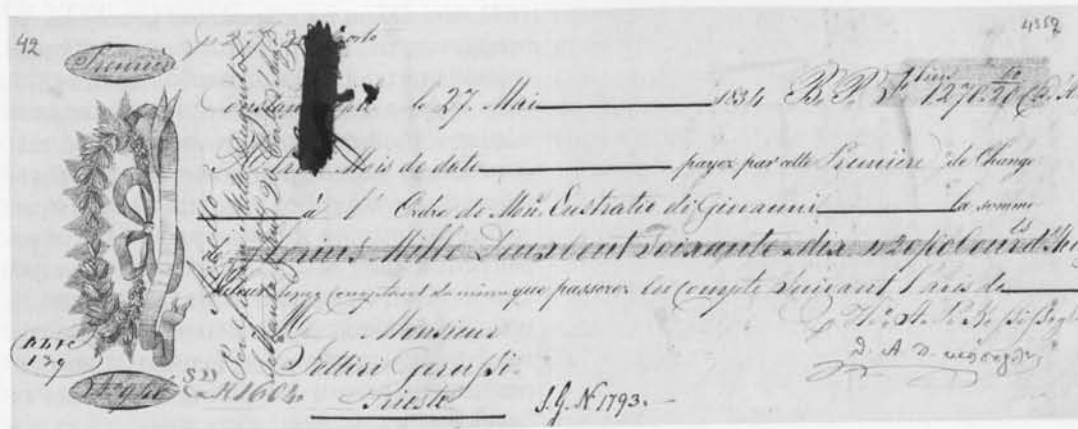
ΣΥΝΑΛΛΑΓΜΑΤΙΚΗ του 1834.