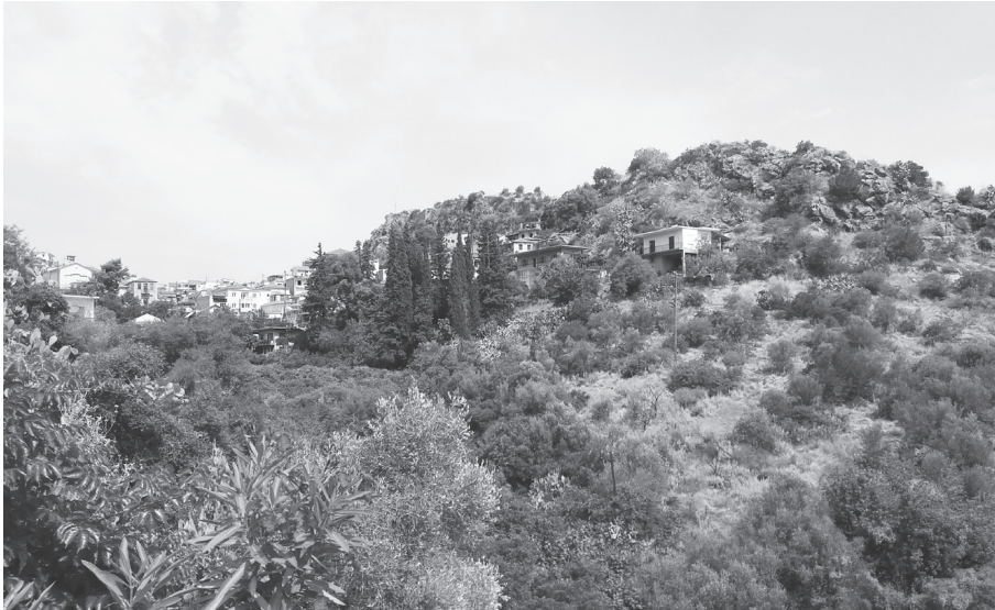
Άποψη του χωριού της Νέας Επιδαύρου (φωτογραφία: Αθηνά Χατζηδημητρίου).

λαδή ένα χωριό κοντά στο μέσο όρο των οικισμών της Πελοποννήσου που σύμφωνα με τα τεκμήρια αυτά κινείται περί τις 121 οικογένειες· οπωσδήποτε όμως τα πληθυσμιακά δεδομένα δεν δικαιολογούσαν την αναβάθμισή του χωριού σε πόλη, μια απόφαση που είχε χαρακτήρα τιμητικό και πολιτικό. 10