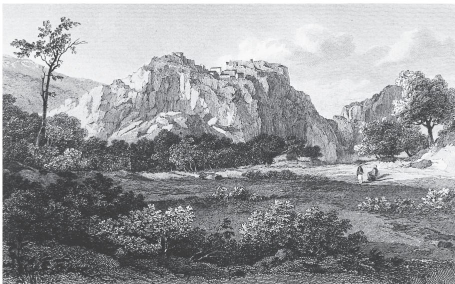
Το χωριό της Πιάδας, στην έκδοση του Edward Dodwell, A classical and topographical tour through Greece, during the years 1801, 1805, and 1806 , Λονδίνο 1819.

Porto Porro με πληθυσμό 67 οικογενειών (255 κατοίκων). 6 Περιηγητές που επισκέφτηκαν την περιοχή τον 18ο αιώνα και στην προεπαναστατική περίοδο καταγράφουν την ύπαρξη του χωριού και θαυμάζουν τη φυσική διαμόρφωση. 7 Ο συνδυασμός αυτός των σπιτιών του χωριού με την επιβλητική παρουσία των φρουριακών ερειπίων αποτυπώνεται και στη σχεδιαστική αναπαράσταση που περιλαμβάνεται στο βιβλίο του Έντουαρντ Ντόντουελ (Edward Dodwell), που εκδόθηκε το 1819. 8