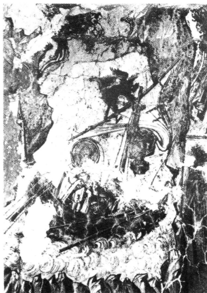
Εικ. 5. Λεπτομέρεια τοιχογραφίας από τον ναό Αγίου Νικολάου του Καμπινάρη, Πλάτσα Μεσσηνίας, 1348 (Nancy Ševčenko, St. Nicholas in Byzantine Art , 28.7)

Η Λυκία, η γενέτειρα του Νικολάου Σιωνίτη και του επισκόπου Μύρων Νικολάου, ήταν γνωστή από την αρχαιότητα για τη ναυτική της παράδοση, όπως άλλωστε και οι γειτονικές περιοχές της Κιλικίας και της Παμφυλίας. Οι