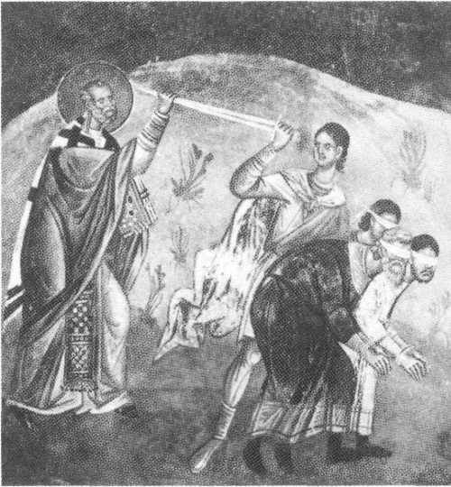
Εικ. 2. Τοικογραφία από τον ναό του Αγίου Γεωργίου, Staro Nagoričino, Σκόπια (1318) (Nancy Ševčenko, St. Nicholas in Byzantine Art , 21.9)

αγίου Νικολάου στα Μύρα, όπου υπήρχε βασιλική αφιερωμένη στη μνήμη του, τα ερείπια της οποίας είναι ακόμα και σήμερα ορατά. Ο άγιος Νικόλαος είχε λοιπόν μια καθιερωμένη τοπική λατρεία και ένα θαυματουργό τάφο που ανέδιδε μύρο. Όμως εκτός από την παραπάνω θαυματουργική δραστηριότητά του, έχουμε απόλυτη άγνοια για τη ζωή του αγίου Νικολάου, οπότε είναι ιστορικά δύσκολο να ανιχνευθούν οι πληροφορίες για τη ζωή του. Αυτή ακριβώς η νεφελώδης προέλευση του αγίου επισημαίνεται στις βυζαντινές πηγές, οι οποίες παραδέχονται ότι ἡ πολιτεία τοῦ ποιμένος τοῖς πολλοῖς ἄγνωστος πέφυκεν . 4 Μολονότι, λοιπόν, τίποτα συγκεκριμένο δεν είναι γνωστό για τον επίσκοπο Μύρων Νικόλαο, η φιλολογία γύρω από τη ζωή του είναι αφθονότατη: εκτός από την πλούσια υμνογραφική παραγωγή, 25 εκδεδομένα κείμενα ευρείας έκτασης και άλλα ανέκδοτα έχει στη διάθεσή της η ιστορική έρευνα, κάτι που υποδηλώνει την αναμφίβολα μεγάλη απήχηση της λατρείας του.