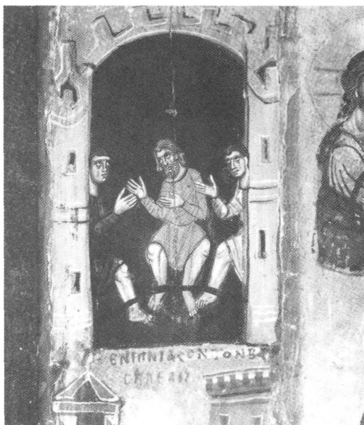
Εικ. 1. Λεπτομέρεια από φορητή εικόνα του 12ου αιώνα από τη μονή Αγίας Αικατερίνης του Σινά (Nancy Ševčenko, St. Nicholas in Byzantine Art , 3.9)

Τον 6ο αιώνα, όταν δημιουργήθηκε η παράδοση με τη διάσωση των τριών αθών και των τριών στρατηγών, φαίνεται ότι διαμορφώθηκε η λατρεία του