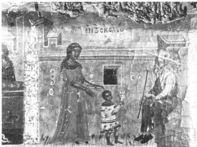
Εικ. 4α. Ο άγιος Νικόλαος οδηγείται από τη μητέρα του στον διδάσκαλο. Σκηνή από φορητή εικόνα της Πάτμου (15ος αι.) (Nancy Ševčenko, St. Nicholas in Byzantine Art , 41.2)

τητα ο Βίος του. Διηγείται λοιπόν αυτό το κείμενο ότι, όταν κάποτε θέλησε ο Νικόλαος ο Σιωνίτης να μεταβεί για προσκύνημα στα Ιεροσόλυμα, θελήματι θεοῦ , δηλαδή με θαυματουργικό τρόπο, εμφανίστηκε ένας ναύκληρος, ο οποίος προθυμοποιήθηκε να τον μεταφέρει στον προορισμό του, σαν να είχε διαβάσει τη σκέψη του. 8 Στο δεύτερο ταξίδι για τους Αγίους Τόπους ο Νικόλαος Σιωνίτης πραγματοποιεί το κλασικό θαύμα εν πλω: καθώς το πλοίο βρισκόταν μεσοπέλαγα, καὶ ὅτε ἐμεσοπελαγοῦμεν λέει χαρακτηριστικά το κείμενο, ο Νικόλαος Σιωνίτης προείπε στους ναύτες ότι είδε τον διάβολο να προσπαθεί να κόψει με δίστομο μαχαίρι τα σχοινιά του πλοίου. Λίγες ώρες αργότερα ένας δυνατός άνεμος φύσηξε και το πλοίο λίγο ἔλειψε να καλυφθεί από τα τεράστια κύματα. Τότε οι ναύτες προσέπεσαν στα πόδια του Νικολάου του Σιωνίτη και αυτός προσευχήθηκε κατανυκτικά και τελικά η θάλασσα πρέμνησε. Την άλλη μέρα, αφού είχε κοπάσει η θύελλα, ένας νεαρός ναύτης Αιγύπτιος, ονόματι Αμμώνιος, αναρριχήθηκε στο κατάρτι και προσπάθησε να το επιδιορθώσει, αλλά ξαφνικά εμφανίστηκε ένας δαίμονας και τον έριξε κάτω νεκρό. Τότε ο Νικόλαος έπιασε από το χέρι τον νεαρό ναύτη και τον σήκωσε όρθιο. 9 Και αυτό