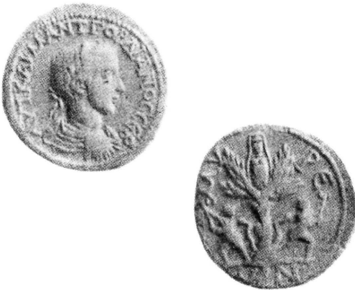
Εικ. 6. Νόμισμα από τα Μύρα της Λυκίας με την Αρτεμις να αναδύεται από το ιερό δένδρο και εκατέρωθεν τους Διόσκουρους (Κ. Καλοκύρης, Τὰ ἱερὰ δένδρα καὶ τὸ ἐξ Ἀνατολῆς καταγόμενο δένδρον τῶν Χριστουγέννων , Ἐπιστημονικὴ Ἐπετηρὶς Θεολογικῆς Σχ. Παν. Θεσσαλονίκης 18 (1973), 325.

δαίμονες που προξενούσαν δέος στους κατοίκους. Έτσι λοιπόν φοβισμένοι οι κάτοικοι των Μύρων ζήτησαν από τον Νικόλαο Σιωνίτη να αντιμετωπίσει έναν δαίμονα που κατοικούσε σε ένα τεράστιο κυπαρίσσι και τρομοκρατούσε τη γύρω περιοχή. Ο Νικόλαος άρχισε να κόβει το δέντρο με το τσεκούρι και ο δαίμονας παραδέχτηκε την ήττα του και αποχώρησε από όλη τη Λυκία. Το παραπάνω θαύμα που επιτελεί ο Νικόλαος Σιωνίτης επιδέχεται ερμηνείας: συμβολίζει την οριστική εκκαθάριση από τα ειδωλολατρικά στοιχεία της περιοχής και την πλήρη επιβολή της χριστιανικής λατρείας μέσω του Νικολάου Σιωνίτη, όχι μόνο στα Μύρα αλλά και σε όλη τη Λυκία. Γι' αυτό και το πνεύμα φέρεται να λέγει: οὐ μόνον γὰρ ὅτι ἐκ τῆς παροικίας τοῦ ἐμοῦ δένδρου ἐξήγαγέν με, ἀλλὰ καὶ ἐκ τῶν μεθορίων τῆς Λυκίας [...] διώκει με. 21 Η αναφορά στο ιερό δέντρο ταιριάζει με την ευρεία λατρεία της Αρτέμιδος, η οποία μαζί με τους Διόσκουρους ήταν οι θεότητες που λατρεύονταν εκεί και απεικονίζονται μάλιστα σε νόμισμα του 3ου μ.Χ. αιώνα. Αξίζει να αναφέρουμε τα κοινά στοιχεία της αφήγησης του Βίου του Νικολάου Σιωνίτη 22 με το νόμισμα κοπής Γορδιανού (238-244), όπου παριστάνεται η Αρτεμις να αναδύεται από το ιερό της δένδρο, ένα κωνοφόρο, και εκατέρωθεν τους Διόσκουρους με μια αξίνα στο χέρι (εικ. 6). Και αυτό το θαύμα με την απομάκρυνση του ακαθάρτου πνεύ-