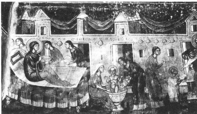
Εικ. 4. Τοιχογραφία από τη μονή Αγίου Δημητρίου, Markon Manastir, Σκόπια (1376-81) (Nancy Ševčenko, St. Nicholas in Byzantine Art , 36.1)

Μόλις έγινε επτά χρονών ο Νικόλαος Σιωνίτης, οι γονείς του τον παρέδωσαν εἰς μάθησιν γραμμάτων . Ο δάσκαλός του δεν ήταν έμπειρος και ο μικρός Νικόλαος, επειδή είχε τη χάρη του Αγίου Πνεύματος, τον διόρθωνε συνέχεια. Η θεόθεν φωτισμένη γνώση του Νικολάου Σιωνίτη ενσωματώνεται στη θαυματουργική δράση του αγίου Νικολάου, απεικόνιση της οποίας έχουμε σε πολλές τοιχογραφίες και φορητές εικόνες, 7 ανάλογη με αυτή της φορητής εικόνας της Πάτμου του 15ου αιώνα (εικ. 4α).