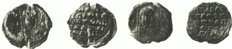
Fig. 4: Pankratiος Diogénès, protospathaire et stratège de Cappadoce (Zacos BnF 206 et 207)