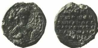
Fig. 7: Romain Diogénès, vestarque et katépanô (Zacos BnF 205)