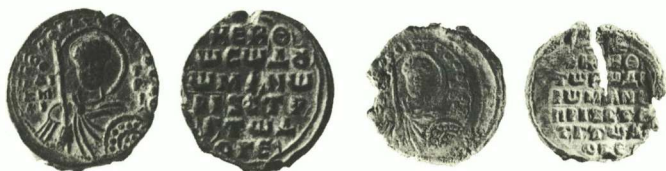
Fig. 6: Romain Diogénès, patrice et stratège (ancienne collection Zacos et Fogg 1396)