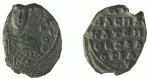
Fig. 1: Diogénès Philomatès, protospathaire et catépan de Thessalonique (Zacos BnF 474)