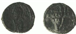
Fig. 5: Diogénès, anthypatos , patrice et ... ? (Fogg 3132)