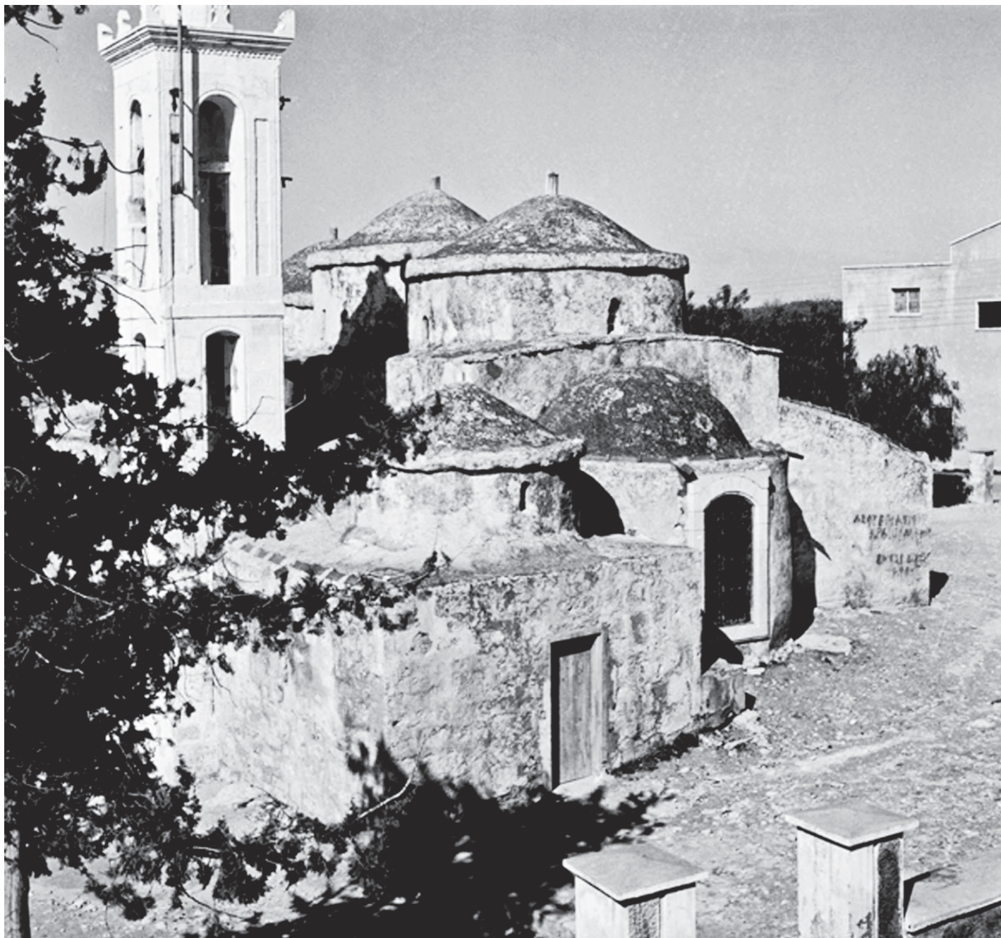
Church of Agia Paraskevi, Geroskipou