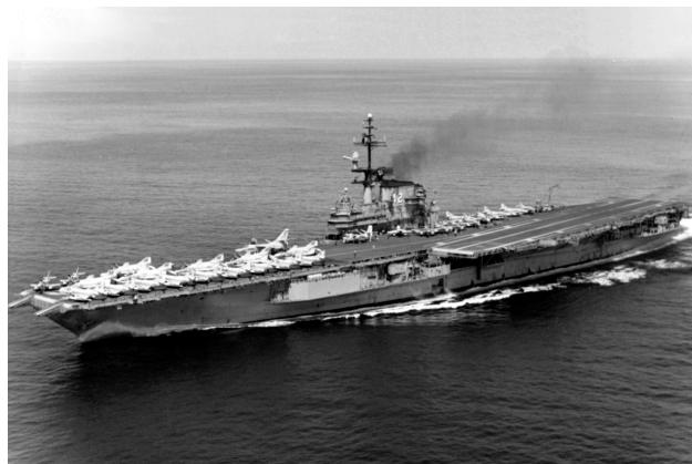
Το αεροπλανοφόρο Franklin D. Roosevelt υποδέχθηκε την ηγεσία της στρατιωτικής δικτατορίας στο Φαληρικό Δέλτα, στις 15.2.1968.