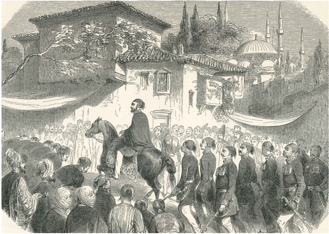
Ο σουλτάνος Αμπντουλμετζίτ επιστρέφοντας από την Υψηλή Πύλη (χαρακτικό) Sultan Abdülmecit Bab-ı Ali'den dönerken (gravür)