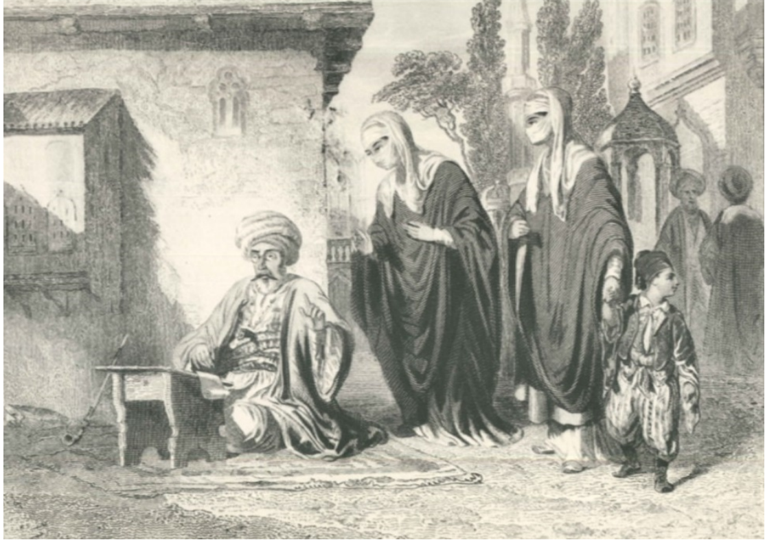
Οθωμανός αιτησιογράφος (χαρακτικό) Osmanlı arzuhalçisi (gravür)