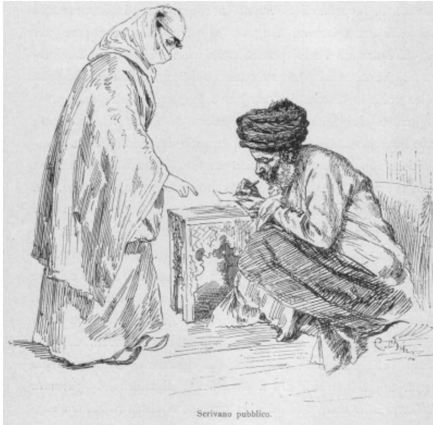
Οθωμανός αιτησιογράφος (χαρακτικό) Osmanlı arzuhalçisi (gravür)