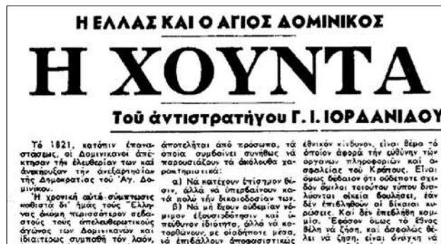
Τὸ πρῶτο ἄρθρο περὶ Χούντας τοῦ στρατηγοῦ Ἰορδανίδη ἐφ. Τὸ Βῆμα , 21 Μαΐου 1965

Τὴν ἴδια χρονιά, ὁ ὄρο εἶχε ἤδη χρησιμοποιηθεῖ καὶ στό πλαίσιο μιᾶς ἄλλης ἀραβικῆς χώρας, ἀλλὰ ἀφορούσε στὴν τελειῶς ἀντίπερα ὄχθη: ἀναφερόταν στὴν ὁμάδα τῶν γάλλων στρατιωτικῶν πού, τὸ Μάιο τοῦ 1958, στό μέσον τοῦ