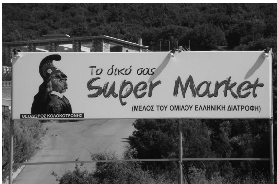
12. Διαφήμιση σύγχρονου σούπερ μάρκετ στην Αρχαδία (φωτογραφία: Χρήστος Χρυσανθόπουλος).