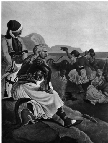
7. Ο Θεόδωρος Κολοκοτρώνης παρακολουθεί διασκέδαση των πολεμιστών του. Πίνακας του P. Von Hess. Δημοσιεύεται στο Γ. Τσούλιος - Τ. Χατζής (επιμ.), Ιστορικό Λεύκωμα της Ελληνικής Επανάστασης , τ. Α', Αθήνα, Μέλισσα, 1970, σ. 183.