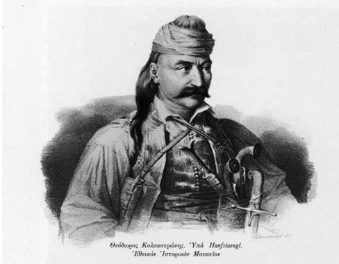
4. Απόδοση του Θ. Κολοκοτρώνη από τον Καρλ Κρατζίιζεν, σε λιθογραφία του Franz Hanfstaengl.

5. «Ο πρίγκιψ Κολοκοτρώνης, πρόεδρος της Ελλάδος». Έγχρωμη γερμανική λιθογραφία με φανταστική απεικόνιση του Κολοκοτρώνη. Μουσείο Μπενάκη. Δημοσιεύεται στο Γ. Τσούλιος - Τ. Χατζής (επιμ.), Ιστορικόν Λεύκωμα της Ελληνικής Επανάστασεως , τ. Α', Αθήνα, Μέλισσα, 1970, σ. 224.