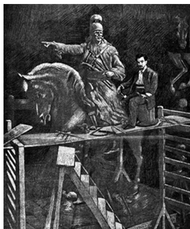
14. Ο γλύπτης Λάζαρος Σώχος ενώ εργάζεται για την κατασκευή του έφιππου ανδριάντα του Κολοκοτρώνη που τοποθετήθηκε στην Αθήνα. Δημοσιεύεται στο Κων. Φ. Σκόκος, Εθνικόν Ημερολόγιον 1895 , Αθήνα 1895.