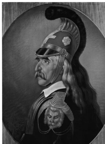
8. Θεόδωρος Κολοκοτρώνης, έργο του Διονυσίου Τσόκου. Εθνικό Ιστορικό Μουσείο.