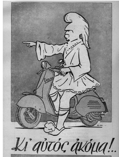
11. Διαφήμιση της Vespa, από το περιοδικό Η κοινή γνώμη και η Σφυγμομέτρησης . Μάρτιος, 1955, Περίοδος Β', αριθ. φύλλου 21, σ. 2.