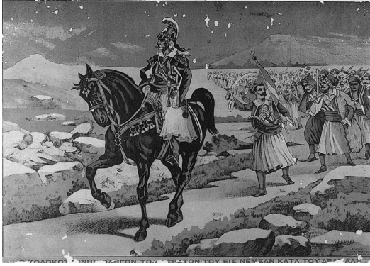
10. Ο Θ. Κολοκοτρώνης οδηγεί τον στρατόν του εις Νεμέαν κατά του Δράμαλη. Λαϊκή έγχρωμη λιθογραφία. Β. Πετροπούλου - Π. Γαργατάνης (επιμ.), Χρέος Τιμής στο Εικοσιένα , Ιστορικό-Λαογραφικό Μουσείο Κορίνθου, Αθήνα 2001, σ. 37.