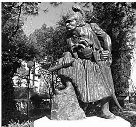
15. Ανδριάντας του Θ. Κολοκοτρώνη στο Χαλάνδρι, έργο της Αικατερίνης Κοσμά Τζαβάρα.