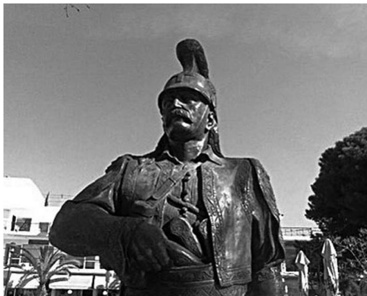
13. Προτομή του Θ. Κολοκοτρώνη στα Βριλήσσια, έργο του Κώστα Καζάκου.