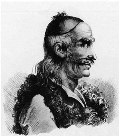
6. Θεόδωρος Κολοκοτρώνης. Πινακοθήκη του Μουσείου Πύλου. Δημοσιεύεται στο Γ. Τσούλιος - Τ. Χατζής (επιμ.), Ιστορικόν Λεύκωμα της Ελληνικής Επανάστασεως , τ. Α', Αθήνα, Μέλισσα, 1970, σ. 222.