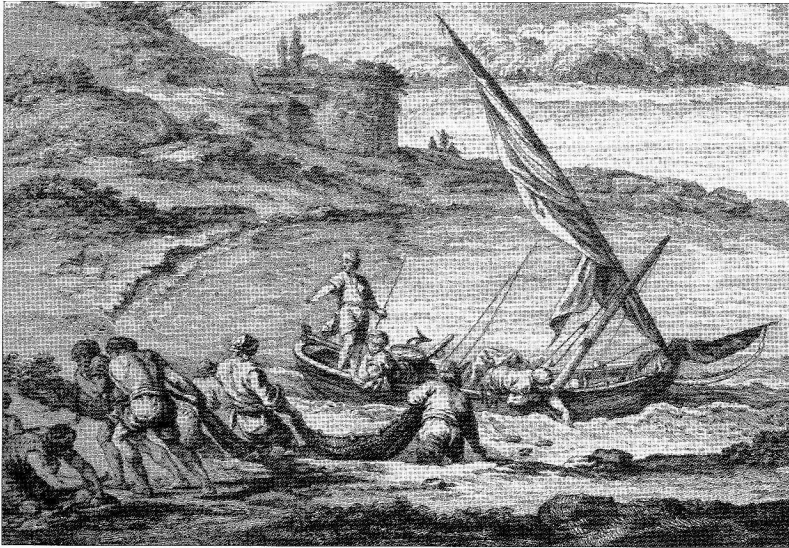
Ψαράδες σέρνουν τράτα στην άκτῆ τοῦ Φαλήρου Λεπτομέρεια ἀπὸ χαλκογραφία τοῦ J.-D. Le Roy, Les ruines des plus beaux monuments de la Grèce , Παρίσι 1770 (Τόπος καὶ Εἰκόνα, τ. 3, Ἀθήνα 1979, σ. 146)