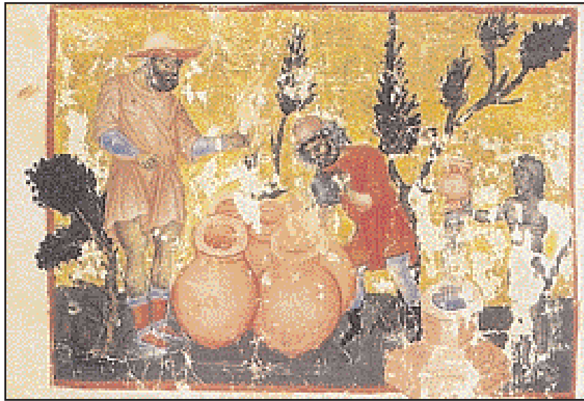
Η καθαριότητα και η διατήρηση σε καλή κατάσταση των πίων ήταν κύριο μέλημα των αμπελουργών. Συχνά, πίθοι και υδρίες εικονίζονται εκτός από τις παραστάσεις του γάμου στην Κανά και στις ειδούς των δώδεκα μηνών και μάλιστα στο μήνα Ιανουάριο, οπότε δοκιμάζονταν και τα νέα κρασιά. Μικρογραφία χφ. του έτους 1346, Μονή Βατοπεδίου αρ. 1199.

Ο αυτοκράτορας Κωνσταντίνος Ζ' ο Πορφυρογέννητος (945-959) στο έργο Περί Βασιλείου Τάξεως όπου έχουν συγκεντρωθεί κείμενα τα οποία αφορούν την αυλική εθιμοτυπία, περιγράφει μια τελετή η οποία γινόταν στο πλαίσιο του τρύγου στο ανάκτορο της Ίερείας, στην ασιατική ακτή του Βοσπόρου. Η περιοχή ήταν γνωστή για τους αμπελώνες της ήδη από την πρωτοβυζαντινή περίοδο. Στην τελετή συμμετείχαν ο αυτοκράτορας, ο πατριάρχης, τα μέλη της Συ-