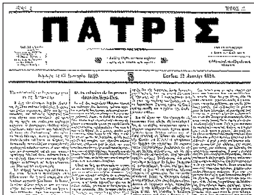
Το φύλλο αριθμός 1 της κερκυραϊκής μεταρρυθμιστικής εφημερίδας «Πατρίς», η οποία αναδείχθηκε σε κορυφαία εφημερίδα του μεταρρυθμιστικού χώρου. Το πρωτοσέλιδο άρθρο «Της η αποστολή της δημοσιογραφίας εν τη Επτανήσω» δίνει ακριβώς το πλαίσιο αρχών και πολιτικής δράσης των Μεταρρυθμιστών.