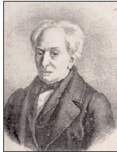
Ο Ανδρέας Μουστοξύδης (175–1860), ιστορικός και λόγιος, εξέχον μέλος της ομάδας των προσωπικοτήτων που ήταν συσπειρωμένη στην παράταξη των Μεταρρυθμιστών. Το 1851–52 εξέδιδε στην Κέρκυρα την εφημερίδα «Φιλαλήθης».