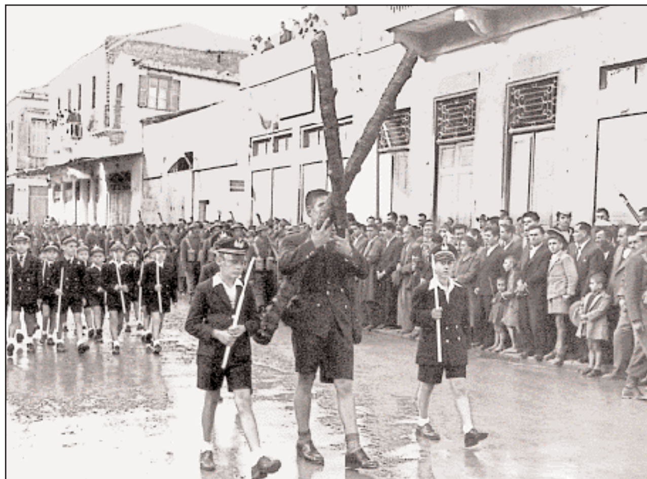
Πάτρα 30.11.1949. Η λιτανεία του Αγίου Ανδρέα.

τήν. Μάλιστα, μοναχός, που υπηρετεί τον 9ο αι. στο ναό του αποστόλου Ανδρέα στην Πάτρα, θα αναγνωρίσει στο πρόσωπο του Βασιλείου του Α', το μελλοντικό αυτοκράτορα του Βυζαντίου, ιδρυτή της Μακεδονικής δυναστείας.