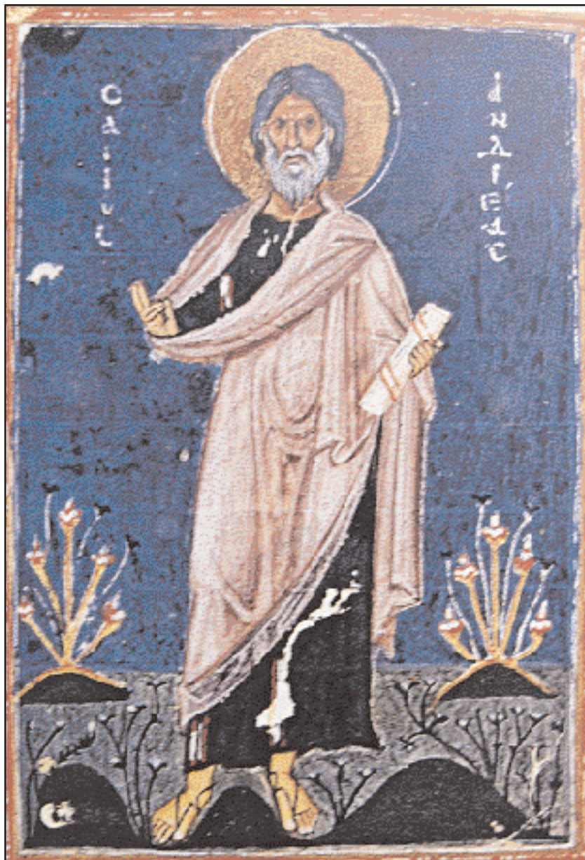
Ο Απόστολος Ανδρέας σε μικρογραφία χειρογράφου κώδικα (12ος αι.). Αγίου Όρους. Μονή Δοχειαρίου (φωτ.: «Οι Θησαυροί του Αγίου Όρους» Εκδοτική Αθηνών, Αθήνα 1979).

Την επόμενη γνωστή φάση της ιστορίας της πόλης άμεσα συνδεδεμένη με τον απόστολο Ανδρέα αποτελεί η πολιορκία της από τους Σλάβους και Σαρακηνούς κατά τη διάρκεια της βασιλείας του Νικηφόρου Α'. Ο Κωνσταντίνος Πορφυρογέννητος στο έργο του Προς τον ίδιον υιόν Ρωμανόν περιγράφει την ασφυκτική πολιορκία της πόλης και την τραγική κατάσταση στην οποία είχαν περιέλθει οι κάτοικοι, εξαιτίας της έλλειψης τροφίμων και νερού. Εκείνη ακριβώς τη στιγμή της δοκιμασίας, οι Πατρινοί άνοιξαν τις πύλες του κάστρου και επέτρεψαν κατά των Σλάβων, όταν είδαν μπροστά τους τον απόστολο Ανδρέα έφιππο να καταδιώκει τους εχθρούς και να τους κατατροπώνει. Οι Σλάβοι τρομαγμένοι κατέφυγαν στο ναό του Αποστόλου Ανδρέα ζητώντας άσυλο. Με χρυσόβουλλο του αυτοκράτορα Νικηφόρου οι ηττημένοι Σλάβοι με τις οικογένειές τους και την περιουσία τους περιήλθαν στον ομώνυμο ναό. Η θαυματουργική παρέμβαση του Αποστόλου κατά τα γεγονότα του 805 συνδέει άμεσα τον Ανδρέα με τη σωτηρία της πόλης και ενισχύει άρρηκτα τη σχέση του με αυ-