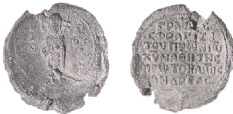
Μολυβδόβουλλο του μητροπολίτη Πατρών Ιωάννη (12ος αι.). Στον εμπροσθότυπο εικονίζεται ο Άγιος Ανδρέας όρθιος, ευλογώντας με το ένα χέρι και κρατώντας πατριαρχικό σταυρό με το άλλο. Στον οπισθότυπο δύο δωδεκάσύλλαβοι στίχοι: Γραφ[ά]ς σφραγίζει του Π(ατ)ρών Ιω(άννου) / Χ(ριστο)ύ μαθητής πρωτόκλητος Ανδρέας (J. Nesbitt and N. Oikonomides), (φωτ.: «Catalogue of Byzantine Seals at Dumbarton Oaks and in the Fogg Museum of Art», Ουάσιγκτον).

Παρά τη σύγχυση που δημιουργούν πολλά από αυτά τα σχετικά με τον απόστολο Ανδρέα αγιολογικά κείμενα, ο ιστορικός πυρήνας της παράδοσης αυτής ενισχύεται από την παράδοση για την ύπαρξη ναού αφιερωμένου στη μνήμη του αποστόλου. Ο ναός βρισκόταν κοντά στην παραλία της Πάτρας, εκεί όπου ο απόστολος Ανδρέας υπέστη το μαρτυρικό θάνατο. Μετά την ανασκαφική έρευνα που πραγματοποιήθηκε στη θέση αυτή, επισημάνθηκε αψίδα, που αποδόθηκε σε παλαιохριστιανική βασιλική. Επίσης, στα νότια του ναού του Αγίου Ανδρέα, ήρθε στο φως ένα μεγάλο ρωμαϊκό βαλανείο, στο οποίο ανήκει ο διάδρομος με τον κυλινδρικό θόλο, που βρίσκεται δίπλα στο αγίασμα του Αγίου Ανδρέα και πε-