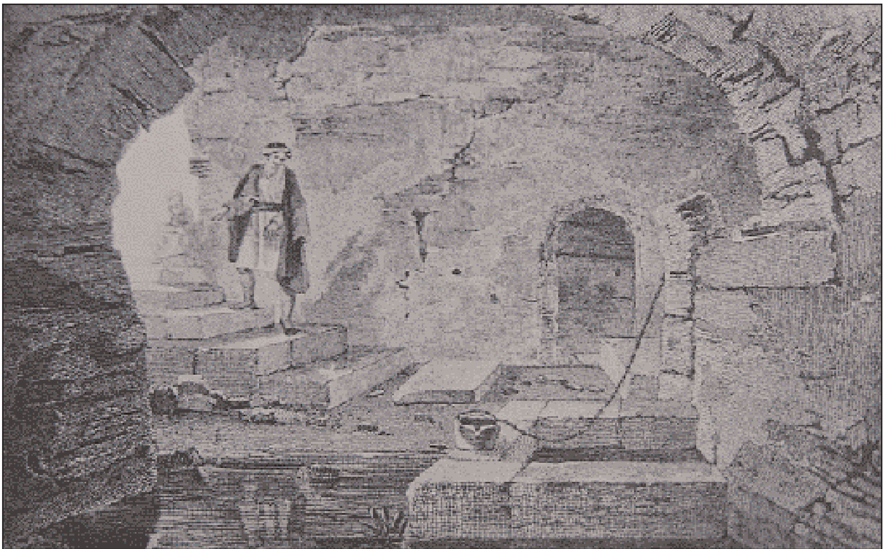
Πάτρα. Η παρά το ναό του Αγίου Ανδρέα κρύπτη με το Αγίασμα, σύμφωνα με το σχέδιο του Romardí (1805).

Ιστορικά και αρχαιολογικά τεκμήρια μιας μακραίωνης παράδοσης