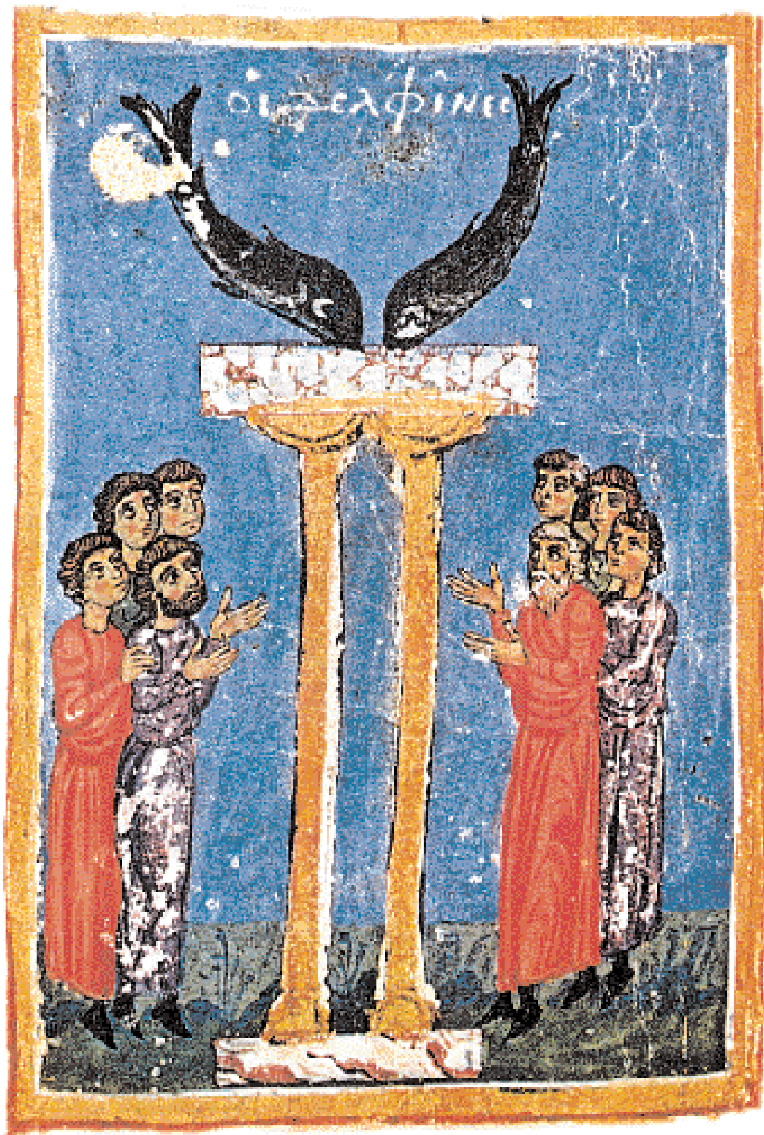
◀ Οι Δελφίνες. Το ιερόν Τροφονέως και Αγαμήδου. Βυζαντινός κώδιξ 12ου αι. (Άγιον Όρος, Μονή Παντελεήμονος κώδ. 6, φ. 164 β).