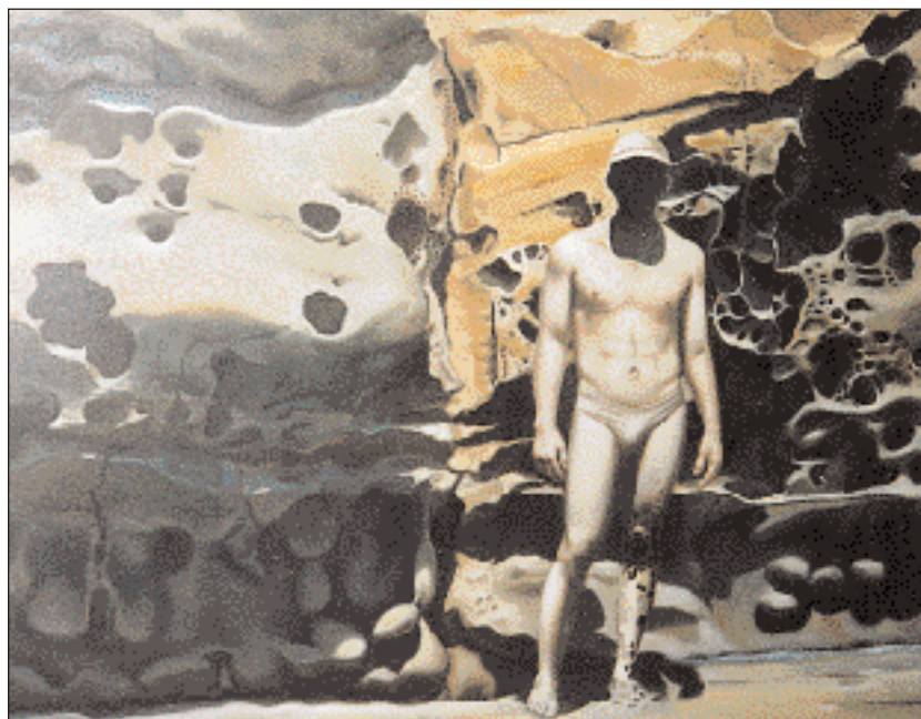
► «Και το ψηλό αιγαιοπελαγίτικο καμπαναριό του κοιμητηρίου των προγόνων να μεταμορφώνεται σε γιγάντιο κορμί ερωτικού κούρου».

Κ ΡΗΤΙΚΗ αλισάχνη τα χείλη μας, αλός άχνη στ' αγρυπνισμένα βλέφαρά μας, διψασμένη η ψυχή μας για όνειρα στο αυγουσιάτικο νησί που ναυαγήσαμε, σπονδή στις ξέρες από το δέπας του ήλιου στο νυκτερινό ταξίδι του προς το Ερεβος. Αλυκές τα σώματά μας, για να στεγνώσουν πάνυγρα τα αυγουσιάτικα όνειρά μας, στοιβαγμένοι πάλλευκοι σωροί στα θαλασσινά τηγάνια. Διψασμένα όνειρα ημερονυκτίων, θαλασσοδαρμένα, ιδροκοπημένα, εξατμισμένα, με αναπάντητη την απορία: Ποιος κοιμάται ναυαγός μέσα στον Αύγουστο; Μέγιστη αγρύπνια μέσα στο πιο μεγάλο, το διαρκές ενύπνιο των διακοπών, στην αδιάλειπτη εγρήγορση των πόθων που μάχονται κάθε τεχνητή παραίσθηση, πλην της διονυσιακής ευωχίας. Η μέρα απέραντος πόντος καταφεύγει να υγράνει την αγκαλιά των νυκτερινών κόλπων. Η μέρα ατέλειωτο ακρωτήριο εισχωρεί βαθιά στη θάλασσα της νύχτας, κι η υγρή νύκτα εξημερώνεται φλεγόμενη στις πυρκαγιές του μεσημεριού. Όνειρα ημερήσιων ύπνων αναζητούν τις ερμηνείες τους στα νυκτερινά φώτα κι αποκρυπτογραφούνται στην αυγουσιάτικη πανσέληνο.