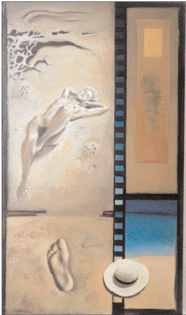
▲ «Αλυκές τα σώματά μας, για να στεγνώσουν πάνυγρα τα αυγουσιάτικα όνειρά μας, πάλλευκοι σωροί στα θαλασσινά τηγάνια... Ποιος κοιμάται ναυαγός μέσα στον Αύγουστο;».