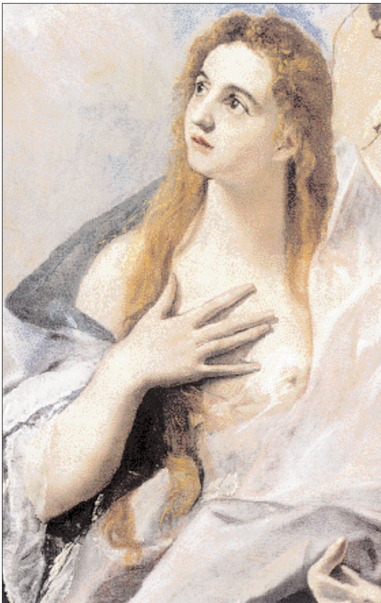
◀ Η Μαγδαληνή, ανηπόγραφος πίνακας του Δομήνικου Θεοτοκόπουλου, (1577 περ.). Βονδαπέστη, Μουσείο Καλών Τεχνών (πηγή: «Δομήνικος Θεοτοκόπουλος Κρης». Εκδ. Δήμος Ηρακλείου Κρήτης, 1990).

Ανδρέου Κρήτης, που διά προσευχής το σύννεφο έφερε βροχή στην Ξηρασία του νησιού και πάσα φυτεία ανέζησε και υπήρξε μεγάλη και πρωτοφανής ευφορία και συνήλθον οι κάτοικοι και εδροσίσθησαν. 6η του αυτού μηνός, Αστειού Δυρραχίου, που επίσης μέλιτι χρισθείς και υπό μελισσών κεντούμενος, τελειούται. 7η του αυτού μηνός, οι μέλισσες βομβούν από το Σμάρι ως το Βορίτσι και τον μελισσόκηπο, μέσα στ' αμπέλια και μέσα στα θυμάρια, όπου και το ξωκλήσι της Κυριακής, Κυριακούλας των βουνών και των κάμπων. Αγάλια-αγάλια μέλι... 15η του αυτού μηνός, Κηρύκου και Ιουλίττης, στη μυρουδιά της θρούμπας, της φασκομπλιάς, του θυμαριού, του καπρικού στα λεμονόφυλλα, της ρίγανης. 16η του αυτού μηνός, η ελαφίνα και τα ελαφόπουλα μπαίνουν στις εκκλησιές προσκυνητές στη μνήμη του Αθηνογένους. 17η του αυτού μηνός, Μαρίνα τους θανατηφόρους δαίμονες εις τας αβύσσους εβύθισες, και κάτω απ' το πλατάμι στη βρύση με ένα καλάθι σύκα της Αγίας Μαρίνας σύκο μελώνεις πάθη και δαιμονικούς καημούς.