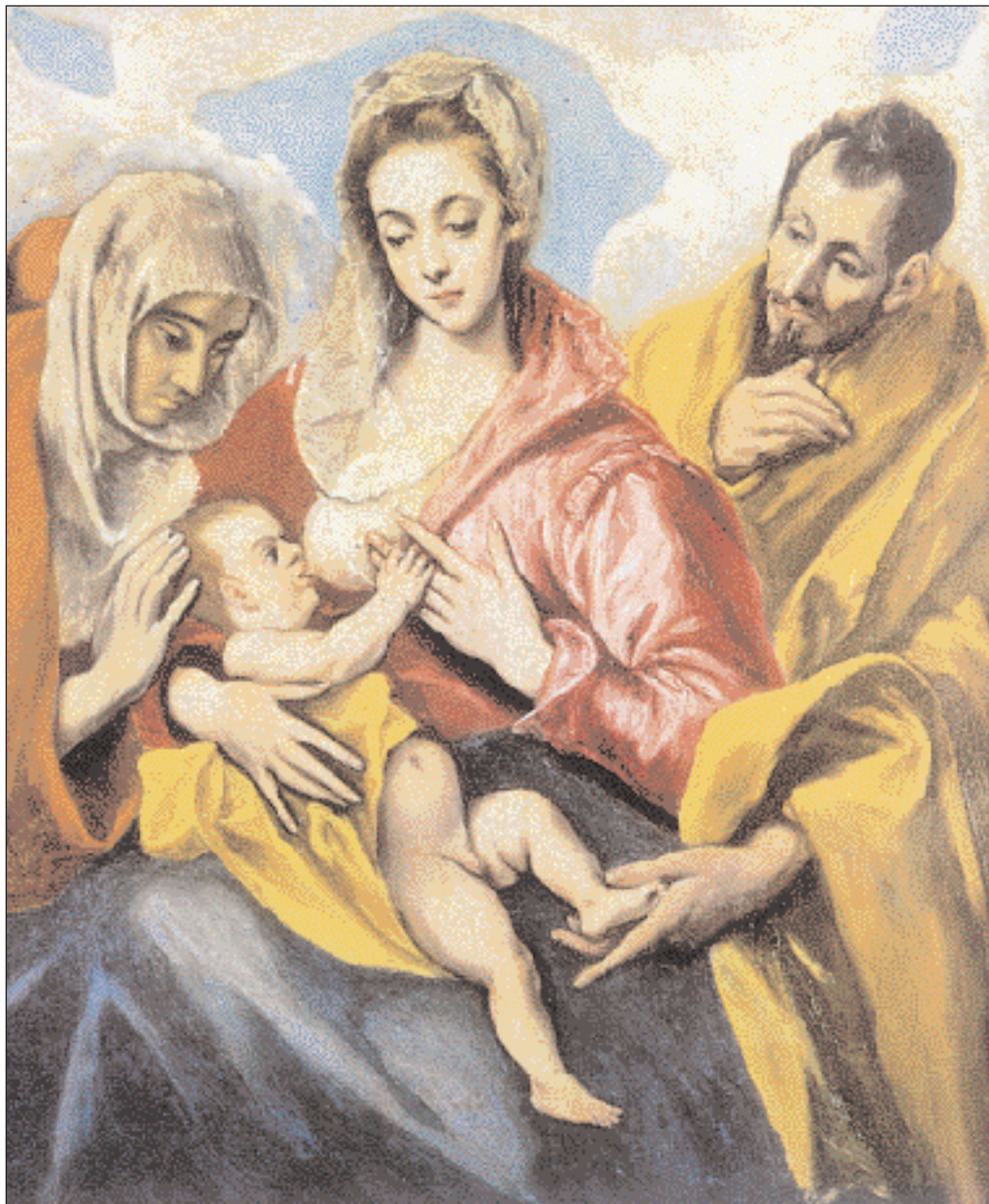
▲ Δομήνικον Θεοτοκόπουλον, «Η Αγία Οικογένεια», 1595. Η Θεοτόκος θηλάζει το Βρέφος κάτω από το τρυφερό βλέμμα της Άννας, που εθήλασε και την ίδια. Τολέδο, Νοσοκομείο Ταβέρα (πηγή: «Οι κλασικοί της τέχνης. Γκρέκο». Εκδ. Ν. Βόισης).