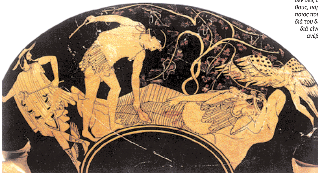
◀ Θησέας και Αριάδνη στη Νάξο. Υποχώρωντας στη θέληση του Διονύσου, ο Αθηναίος ήρωας εγκαταλείπει την αγαπημένη του, πάνω από την οποία πειάει ο Έρωτας, ενώ απλώνεται να την αγκαλιάσει το τερόφντο του θεού, η κληματαριά. Ερυθρόμορφη κέλικα, 490-480 π.Χ. Ταρκοννία, Εθνικό Μουσείο.

«– Μύθος μου μοιάζει ότι είναι το ποτό των θεών, το νέκταρ, κρυσταλλόστηθη, μπρος στην μοναδική γλυκύτητά σου. Αναρωτιέμαι βλέποντάς σε σαν αμπέλι να μαυρορωγιάζεις, αν κάποιος ζουπήξει, σαν γλυκό σταφύλι, το στήθος σου, γλυκό κρασί θα βγει ή μυρωδάτο μέλι! – Ξάπλωσε, κι εγώ σαν κήπος παραδίνομαι σε σένα. Κι αν δεν υπάρχει μήλο, το στήθος μου για μήλο πάρε. Σκύψε, δύστυχε, και πάρ' το, αν θέλεις. Κι αν στην κληματαριά δεν δεις σταφύλι, σφίξε τις ρώγες του τρυφερού μου στήθους, πάρε και την κερήθρα των χειλιών μου. Κι όπως κάποιος που καρπό θέλει να κόψει μπλέκεται μέσα στα κλαδιά του δέντρου, εγώ το δέντρο, με μένα περιπλέξω. Κλαδιά είναι τα δικά μου χέρια, εγώ το δέντρο, πάνω μου ανέβα και δρέψε καρπό γλυκύτερο από μέλι.»