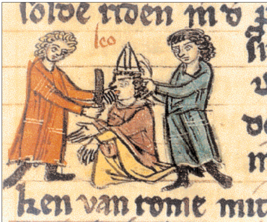
◀ Μικρογραφίες από το «Παγκόσμιο Χρονικό» που φιλοεγνήθηκε στη γερμανική πόλη Gotha το 1270. Αριστερά εξιστορείται η επίθεση και απόπειρα τύφλωσης του Πάπα Λέοντα Γ΄ από τους αντιπάλους του. Κάτω επαναλαμβάνεται η απόπειρα τύφλωσης και απεικονίζεται η φυγή του Πάπα στην αυλή του Καρόλου, όπου έγινε δεκτός με όλες τις τιμές. Δίπλα βλέπουμε τη στέψη του Καρόλου από τον Λέοντα Γ΄ και την αναγόρευσή του σε αυτοκράτορα στην εκκλησία του Αγίου Πέτρου (Ρώμη) κατά τη Θεία Λειτουργία των Χριστουγέννων το έτος 800.