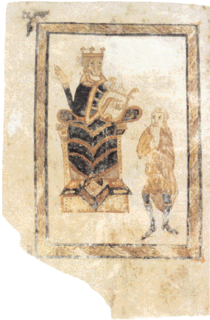
◀ Σελίδα φυλλορίου από τη Δυτική Γαλλία, 830-60. Απεικονίζεται ο βασιλεύς Δαβίδ καθιστός σε θρόνο με τη λύρα στο αριστερό χέρι. Μικροτά τον μουσικός παίζει τη σύριγγα τον Πάνα.

σεις των Βυζαντινών στην Ιταλία, ή θα περιοριζόταν στο βασίλειό του, διακοσμώντας απλώς τη θέση του με τον αυτοκρατορικό τίτλο; Οι διεργασίες στη σκέψη του Καρόλου, ο οποίος φαίνεται πως δεν είχε από την αρχή σαφείς στόχους και οι διπλωματικές διαπραγματεύσεις με το Βυζάντιο κράτησαν δώδεκα χρόνια και πέρασαν από διάφορες φάσεις.