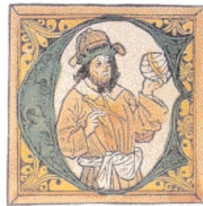
▲ Προσωπογραφία του Κλαυδίου Πτολεμαίου. Κόσμημα σε πρωτόγραμμα, από την έκδοση της Γεωγραφίας του Πτολεμαίου, Ουλμ, 1482.

της αρχαίας σκέψης έμοιασε αληθινή. Ωστόσο, όσο και αν καλλιεργήθηκε με μοναδική επιδεξιότητα το εξωπραγματικό καθώς οι άνθρωποι των γραμμάτων και των τεχνών μετεωρίστηκαν σε νεοπλατωνικές σφαίρες, η κοινωνία της Φλωρεντίας της εποχής εκείνης δεν παραμέλησε την πρακτική πλευρά των πραγμάτων. Μια κοινότητα δραστήριων εμπόρων, βιομηχάνων και τραπεζιτών, από τις πρώτες στην Ευρώπη, κινητοποίησε δραστικά την αποταμίευση, παρήγαγε πλεονασματικά αγαθά και τα προώθησε δυναμικά στις αγορές Ανατολής και Δύσης. Το χρυσό νόμισμα της πόλης, που πήρε το όνομά του από αυτήν, το Φιορίνι, έγινε το νόμισμα των διεθνών συναλλαγών και υιοθετήθηκε από πολλές ευρωπαϊκές χώρες. Με την κατάληψη της Πίζας (1406) και αργότερα του Λιβόρνου (1421), η Φλωρεντία γίνεται θαλάσσια, αποικιοκρατική δύναμη, ενώ η επισφράγιση του διεθνούς ρυθμιστικού ρόλου της θα έλθει με τη σύνοδο της Φεράρας (1439), οπότε θα συρρεύσουν εκεί απεσταλμένοι από τα τέσσερα σημεία του ορίζοντα προκειμένου να συζητήσουν για το μέλλον της Χριστιανοσύνης.