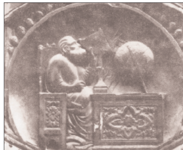
◀ Ο Κλαύδιος Πτολεμαίος, ανάγλυφο στο καμπαναριό του Καθεδρικού της Φλωρεντίας. Έργο των Giotto και A. Pisano.

Η έντυπη διάδοση του έργου είναι αυτή που θα επιβάλει τρόπον τινά τη λογική των αναθεωρήσεων και των προσθηκών. Η έκδοση του Ουλμ του 1482 θα ακολουθήσει στους χάρτες το πρότυπο της δεύτερης έκδοσης του έργου (Ρώμη 1478, η πρώτη έκδοση πραγματοποιήθηκε στην Μπολόνια στα 1477, ενώ η αρχέτυπη έκδοση, χωρίς χάρτες είχε πραγματοποιηθεί στη Βενετία στα 1475) ως προς το νέο σύστημα προβολής με καμπύλους παράλληλους και μεσημβρινούς, και θα συμπεριλάβει πέντε νέους χάρτες. Οι προσθήκες νέων χαρτών στο παλαιό πτολεμαϊκό σώμα θα συνεχίσουν αυξανόμενες. Η έκδοση της Ρώμης του 1508 θα καταγράψει τα πορίσματα των έως τότε ανακαλύψεων, συμπεριλαμβάνοντας στον παγκόσμιο χάρτη τη Βραζιλία και τα νησιά της Καραϊβικής καθώς και σημαντικές βελτιώσεις στην απόδοση της Αφρικής. Η έκδοση της Βενετίας του 1511 θα περιλάβει περισσότερο και ακριβέστερο