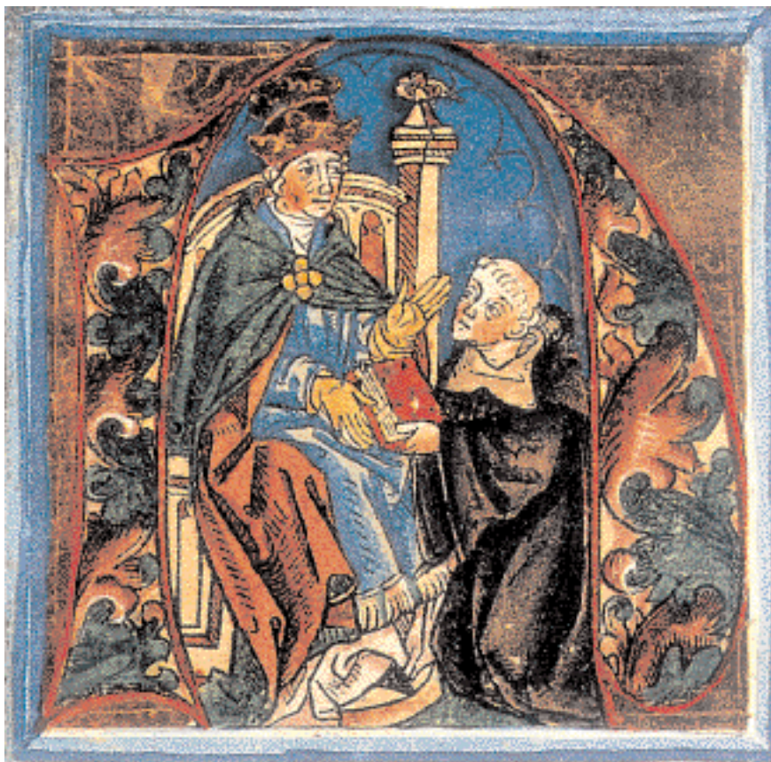
◀ O Dominus Nicholas Germanus προσφέρει τη Γεωγραφία του Πτολεμαίου στον Πάπα Παύλο τον Β΄. Από την έκδοση της Γεωγραφίας του Πτολεμαίου, Ουλμ, 1482.