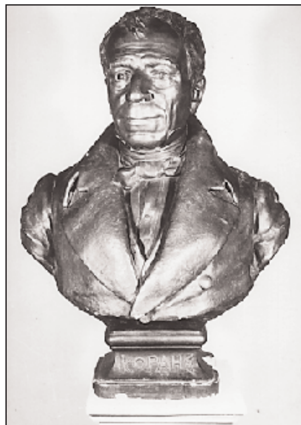
Πρόπλασμα της ορειχάλκινης προτομής του Κοραή, που στήθηκε στον τάφο του, στο Παρίσι, στις 25 Μαρτίου 1895.