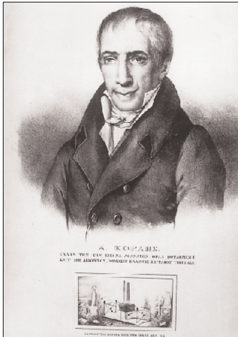
Παραλλαγή της λιθογραφίας του Σμόλνι, με το γνωστό επίγραμμα. Στο κάτω μέρος, η εικόνα του τάφου του Κοραή στο κοιμητήριο του Μονπαρνάς, στο Παρίσι, και το επιτάφιο επίγραμμα. Τυπώθηκε από τον Α. Χαβιρά στο Παρίσι, λίγο μετά το θάνατό του.

την άρνηση, προβάλλοντας τα υψηλά παραδείγματα των αρχαίων, από τους οποίους κανένας δεν στεφάνωσε τον εαυτό του «ούτε της ίδιας του μορφής ανέστησεν εικόνα». Το παράδειγμα του Αγησιλάου τον εκφράζει: «δεν εσυγχωρούσεν να του κάμωσιν εικόνα».