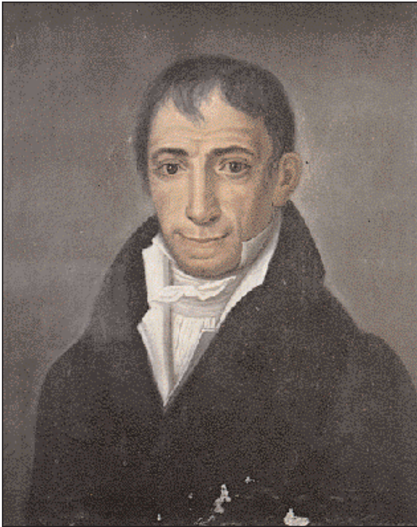
Πορτρέτο του Αδ. Κοραή, η ελαιογραφία που φυλάσσεται ακόμη στο σπίτι του Κωνσταντίνου Τυπάλδου-Ιακωβάτου, σήμερα βιβλιοθήκη-μουσείο Τυπάλδων-Ιακωβάτων στο Ληξούρι.