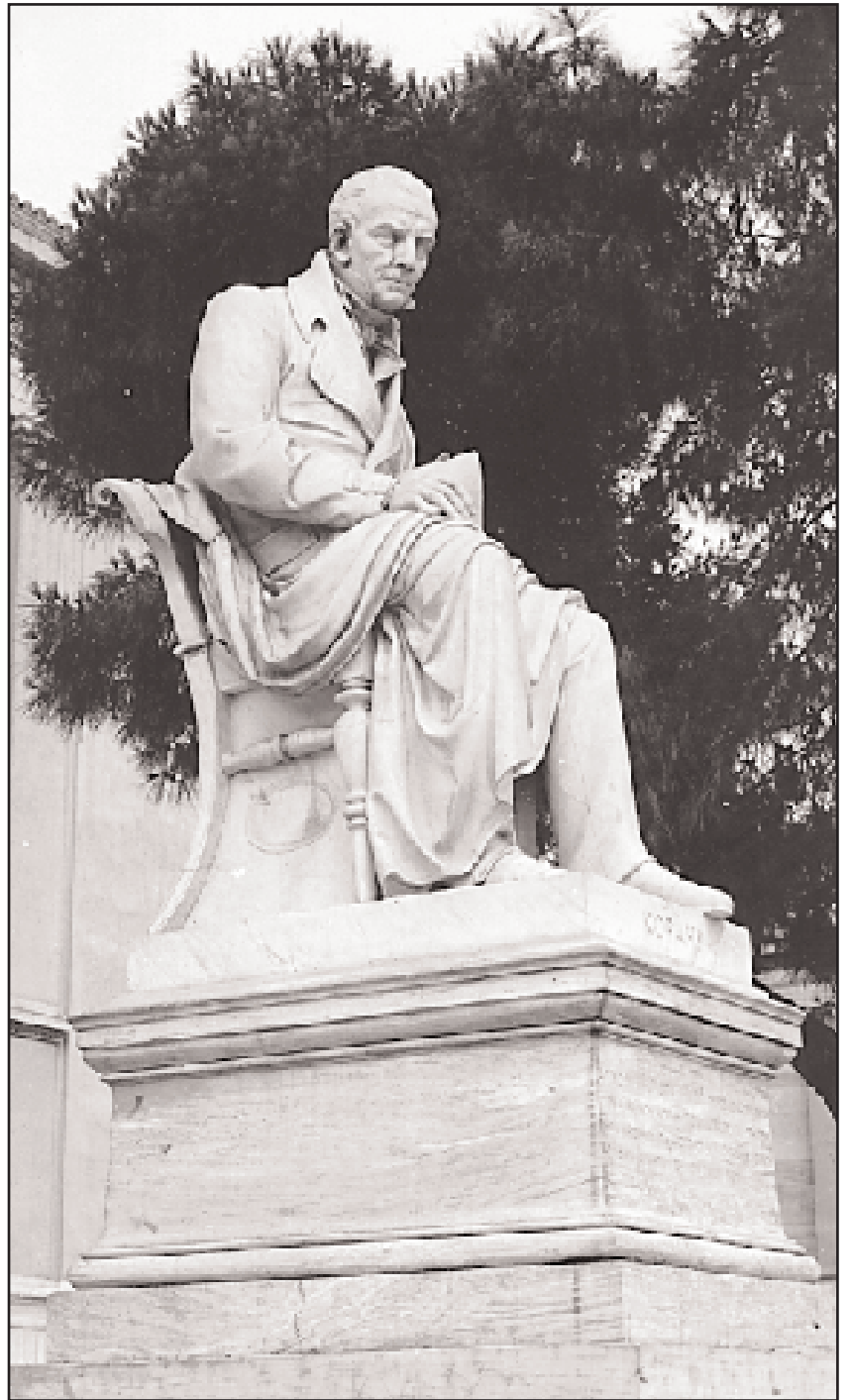
Ο ανδριάντας του Κοραή στα Προπύλαια του Πανεπιστημίου Αθηνών, έργο του Γεωργίου Βρούτου (1873). Τοποθετήθηκε στη θέση όπου βρίσκεται έκτοτε, το 1875.

Συνέχεια από την 19η σελίδα σε μετά τη δεύτερη και αποχαιρετιστήρια επίσκεψη.