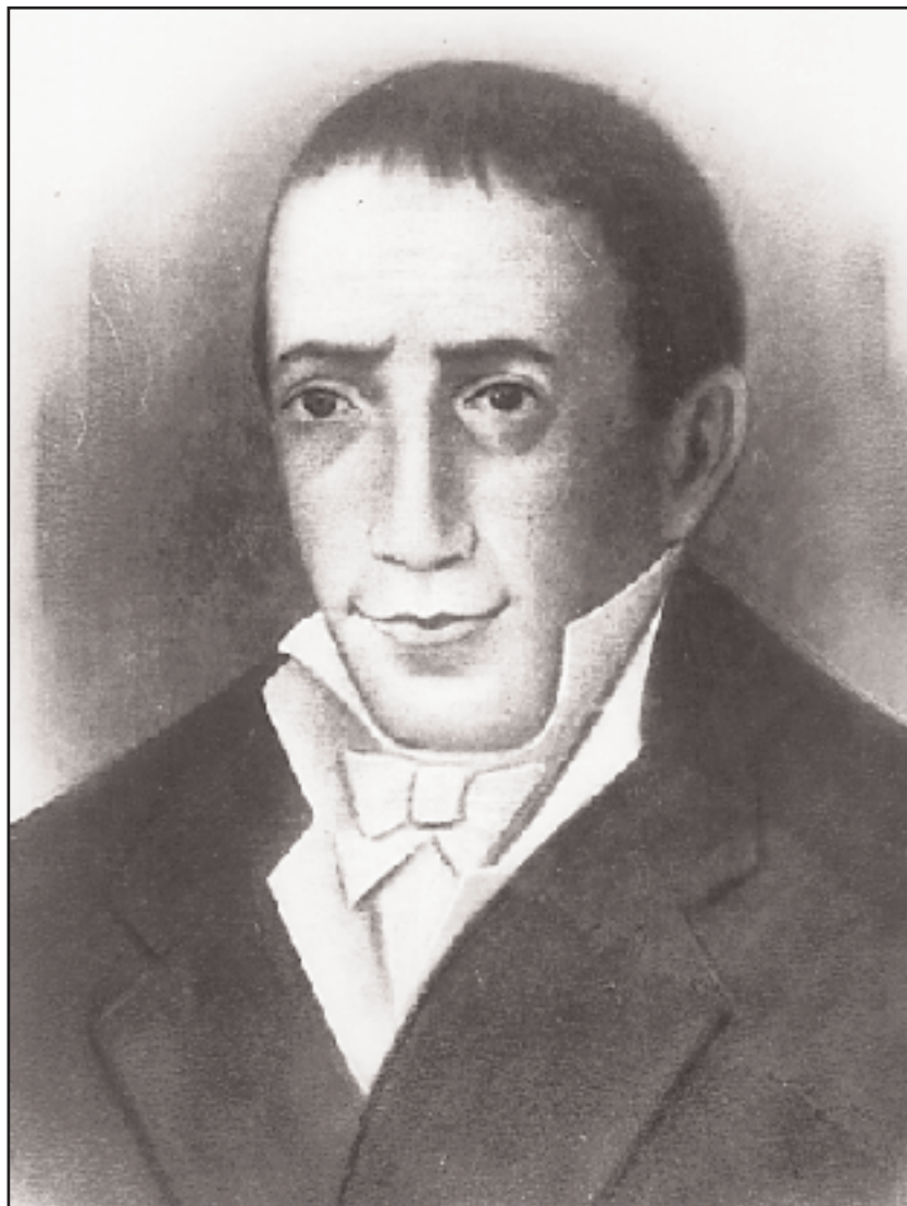
Πορτρέτο του Αδαμάντιου Κοραή, με τάση ωραιοποίησης του μακρινού του προτύπου, της λιθογραφίας του Σμόλκι. Εθνική Βιβλιοθήκη, Αθήνα.

Περισσότερη διάδοση είχε μια άλλη λαϊκή λιθογραφία του 19ου αι. τυπωμένη στο Παρίσι, που παριστάνει ολόσωμους τον Κοραή και τον Ρήγα να ανασκάνουν την Ελλάδα εν μέσω ερειπίων. Τα ιδεολογικά σημαινόμενα της λιθογραφίας είναι προφανή και καθώς η εικονογραφία της ξεπερνά τα όρια της προσωπογραφίας, η παράσταση αυτή διέδωσε περισσότερο την «ιδεολογία» με την οποία συνδέθηκε ο Κοραής, αφού οι προσεγγίσεις προς το πρόσωπο και το έργο του «θόλωσαν» στη δίνη των εθνικών ιδεολογικών αποκρυσταλλώσεων και των κατευθύνσεων της νεοελληνικής παιδείας.