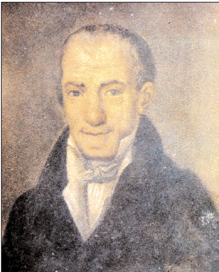
Πορτρέτο του Αδ. Κοραή, έργο του Διονυσίου Τσόκου, με πρότυπο τη λιθογραφία του Σμόλνι, Πανεπιστήμιο Αθηνών.