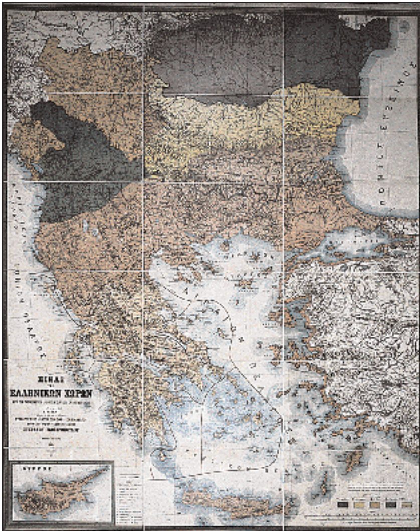
Ε. Κίπερτ, «Πίναξ των Ελληνικών Χωρών μετά την παρακειμένων Αλβανικών, Σλαβικών και Ρουμανικών...». Λειψία, τυπ. Ε.Δ. Νεράντζη, 1891, λιθογραφία 1.500x1.855 mm. Εκδοση του Συλλόγου προς Διάδοσιν των Ελληνικών Γραμμάτων. Ο Κ. Παπαρρηγόπουλος, ένας από τους ιδρυτές του Συλλόγου, είναι ο κύριος εμπνευστής του «εθνοκρατικού» αυτού χάρτη των Βαλκανίων, ένα είδος απλοποιημένου εθνογραφικού χάρτη, ο οποίος παρουσιάζει τις εθνότητες που υπερισχύουν στα Βαλκάνια. Ας σημειωθεί ότι ο Κίπερτ απετάχθη την ευθύνη του χρηματισμού.