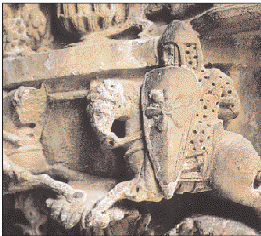
Ιππότης σε νορμανδικό ανάγλυφο του 12ου αι. σε κιονόκρανο, στον καθεδρικό ναό του Μονρεάλε της Σικελίας. Η νορμανδική εισβολή του Γυϊσκάρδου το 1081-1085 στο Βυζάντιο θεωρείται από πολλούς ερευνητές ως προανάκρουσμα της εποχής των σταυροφοριών.

χες άρχοντες, μερικοί από τους οποίους, κατά τις δυτικές συνθήκες, ήταν και επίσκοποι. Οι Βυζαντινοί γρήγορα αντιλήφθηκαν ότι είχαν να κάνουν με στρατό μειωμένης πειθαρχίας που δεν δίσταζε να λεηλατήσει τα χριστιανικά εδάφη. Πιο πολύ όμως ακόμη απορούσαν για το πώς επίσκοποι μπορούσαν να φορούν πανοπλία και να πολεμούν, αγνοώντας προς στιγμήν την αγάπη που είχε κηρύξει ο Χριστός.